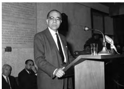
Д-р Хосуэ де Кастро, Бразилия, председатель Совета ФАО в период с 1951 по 1955 гг., выступление на XII сессии Конференции ФАО в Риме, ноябрь 1963 г.

«Голод – это исключение из общества», – писал известный бразильский врач и активный участник борьбы с голодом Хосуэ де Кастро. «Исключение из сфер деятельности, связанных с землей, рабочими местами, заработной платой, доходами, жизнью общества и правами и обязанностями граждан. Если человек доходит до такого положения, когда ему нечего есть, то это означает, что во всем остальном ему было отказано. Это – современная форма изгнания. Это – смерть при жизни».