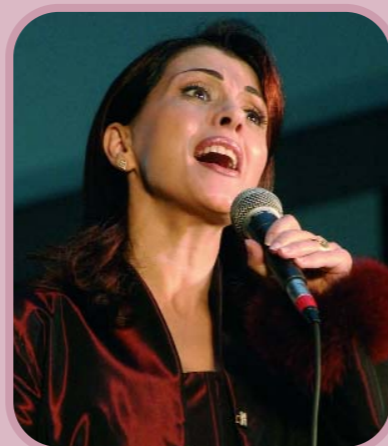
La Embajadora de buena voluntad Magida Al Roumi canta durante la ceremonia de celebración del Día Mundial de la Alimentación en la Sede de la FAO en Roma, Italia

semanario Al Usra Ai Asriya de Dubai y al periódico internacional AlQuds Al-Arabia , donde ha explicado el trabajo de la FAO. Asimismo, a lo largo de los últimos años, Magida al Roumi ha actuado en conciertos destinados a sensibilizar y recaudar fondos para la FAO en Túnez, El Cairo y Argelia.