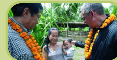
El Embajador de buena voluntad de la FAO Roberto Baggio discute con los beneficiarios de los proyectos FAO en Lao en el curso de su misión

personal al presidente de la Federación Italiana de Fútbol, donde le instaba a formar una asociación entre ambas organizaciones con el objetivo de conseguir impacto mediático y popular de carácter sensibilizador. Este acto de colaboración se materializó en enero de 2008. Entre el 3 y el 5 de septiembre de 2007, tomó parte de una misión oficial en Laos (Lao PDR) para visitar los proyectos de campo de la FAO en dicho país. Esta visita realizó las actividades de la FAO en la región de Asia y en el mundo entero; de este modo, su cobertura mediática brindó una gran resonancia del Día Mundial de la Alimentación en la región.