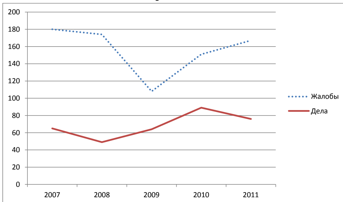
Рис. 1: Количество обращений и дел в 2007-2011 годах

46. В 2011 году по сравнению с 2010 годом, когда отмечалось 33-процентное сокращение по сравнению с 2009 годом, количество жалоб, связанных с ИТ, преследованиями, сексуальным домогательством и превышением полномочий, осталось на прежнем уровне; обращения, связанные с расхищением продовольствия, сократились на 45%. В течение 2011 года был создан официальный комитет по поступлениям для анализа всех поступивших обращений. В результате возросло количество обращений, передаваемых руководству (с 20 в 2010 году до 58 в 2011 году), которые скорее касались вопросов управления или операционных вопросов, нежели требовали расследования в рамках дела.