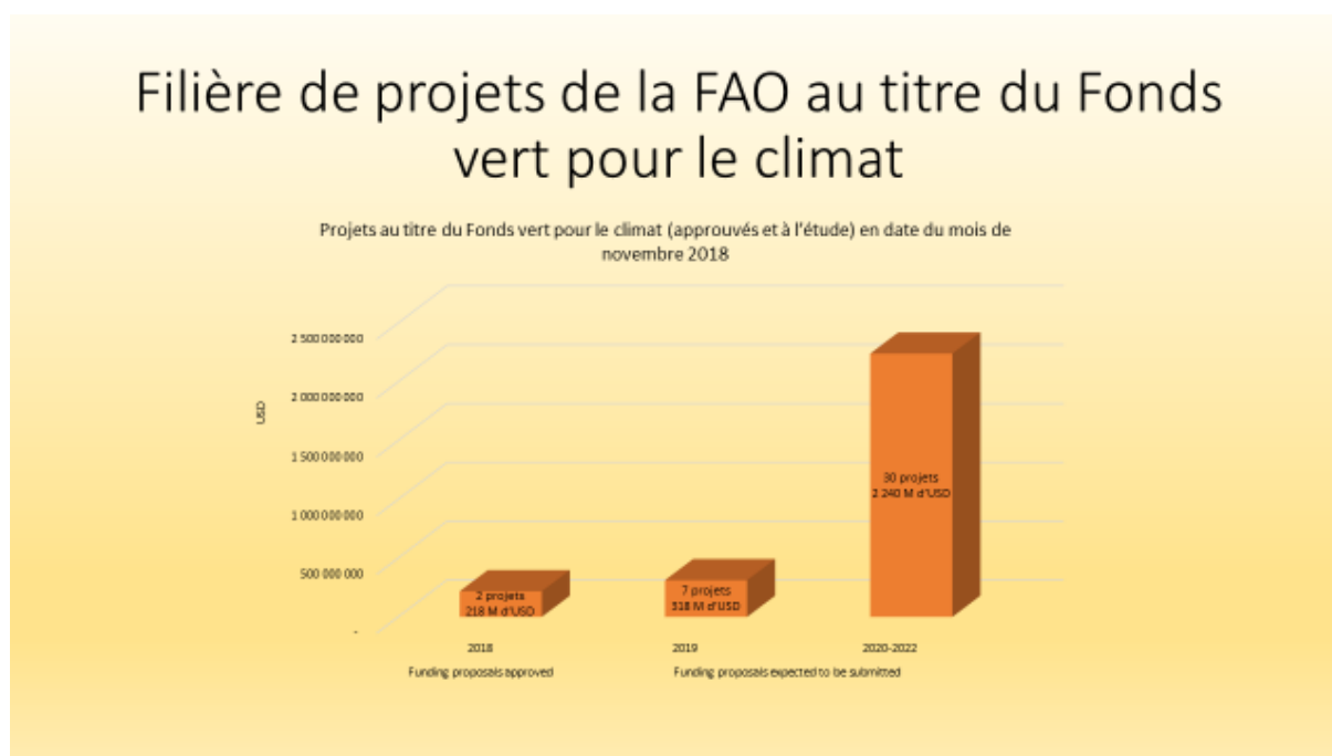
Tableau 1: la FAO et le Fonds vert pour le climat.