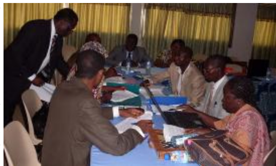
Séance de travail en commission

Le coût global des quatre volets du plan est évalué à cinq milliards quatre cent trente et un million cinq cent quatre vingt mille (5 431 580 000) francs CFA.