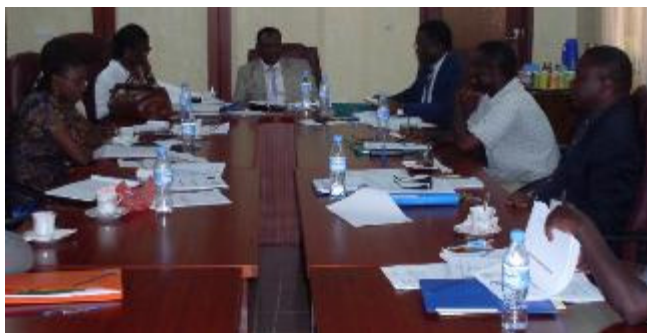
Les membres du CEFI en séance de travail

La deuxième réunion du Comité exécutif du fonds d'indemnisation et d'opération d'urgence pour le contrôle des maladies animales prioritaires (CEFI) s'est tenue le 29 Décembre 2010 dans