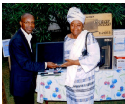
L'Assistant chargé de l'Administration remettant l'ordinateur