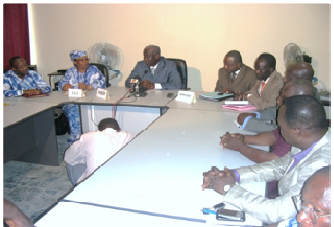
Vue partielle de l'assistance lors du discours du Ministre de l'Agriculture, de l'Elevage et de la Pêche au cours de la cérémonie

Avec la signature de cette convention de financement avec la FAO, le Togo s'apprête à réaliser un nouveau recensement national de l'agriculture, de l'élevage et de la Pêche (RNAEP).