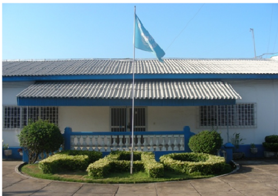
Vue de face du bâtiment principale de la Représentation de la FAO au Togo

L'Accord d'installation de la Représentation de la FAO au Togo a été signé le 25 Juin 1980 à Lomé entre le Gouvernement Togolais et l'Organisation des Nations Unies pour l'Alimentation et