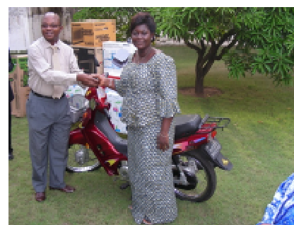
L'Assistant Chargé de Programme remettant les clés à l'heureuse gagnante de la moto dame