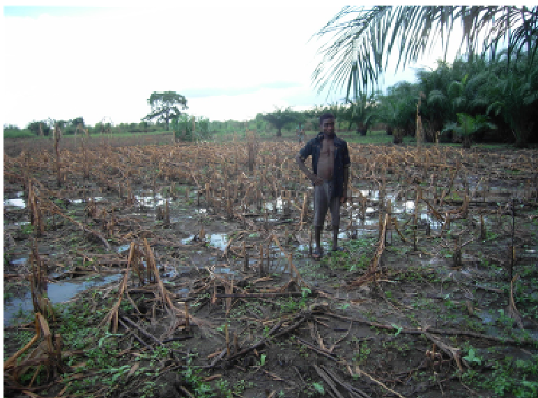
Champ de maïs détruit par les inondations

Suite à une requête du Ministère de l'Agriculture, de l'Elevage et de la Pêche, la FAO a décidé de financer le projet "Réhabilitation des moyens d'existence de ménages ruraux touchés par les inondations de 2010 dans la région Maritime" sur les ressources de son Programme de coopération technique à concurrence de 490 000 USD.