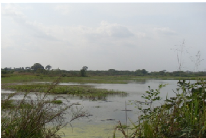
Site de Atti Atovou