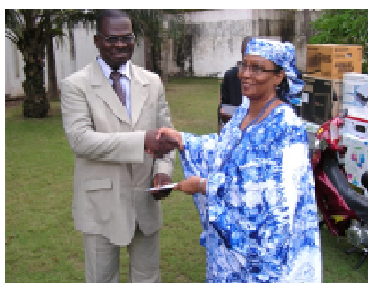
L'heureux gagnant recevant le billet Lomé-Paris-Lomé des mains de Madame la Représentante a.i

Au-delà de la manifestation festive, le point le plus remarquable des 30 ans est l'organisation d'une tombola Telefood, sur l'initiative de la Représentante. Cette tombola, dotée de prix très intéressants, avait pour objectif de recueillir des fonds le compte spécial Telefood. Les prix, composés d'un billet d'avion Lomé-Paris-Lomé, d'une moto-dame, des matériels informatiques et électroménagers, etc.... avaient été offerts par des opérateurs économiques travaillant avec la Représentation. Le tirage au sort s'est déroulé au cours du cocktail dinatoire et les prix ont été remis aux heureux gagnants le mardi 21 Décembre 2010 dans les locaux de la Représentation.