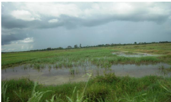
Rizières détruites par les inondations

La FAO estime qu'à la fin de ce projet, les populations bénéficiaires des préfectures de l'Avé, du Bas Mono, du Golfe, des Lacs, de Vo, de Yoto et du Zio auront restauré leurs capacités de production.