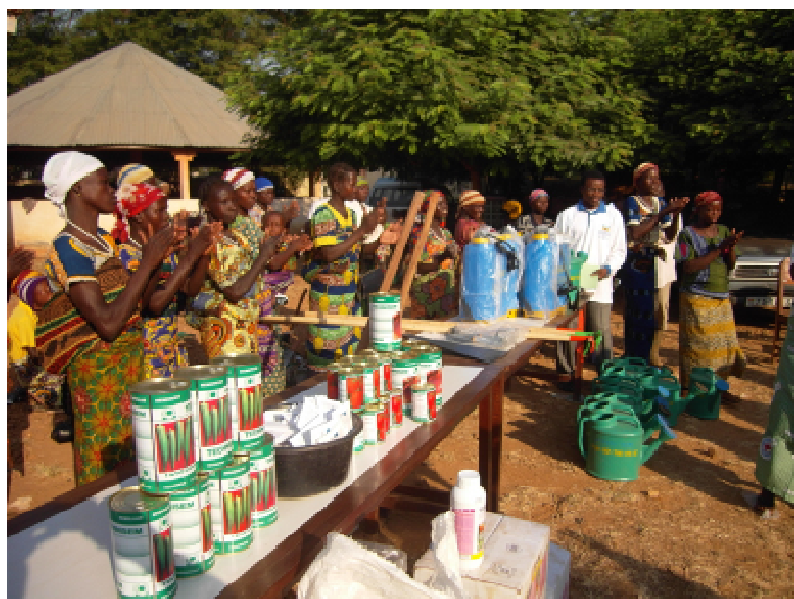
Une partie des bénéficiaires devant un lot de matériels et intrants agricoles

Le projet « Renforcement des bases de la sécurité alimentaire des ménages agricoles vulnérables au Togo » financé par l'Union Européenne et exécuté par la FAO, a décidé dans le cadre de la CARMMA (Campagne Accélérée pour la Réduction de la Mortalité Maternelle et néo natale en Afrique), d'apporter un appui à 500 femmes, allaitantes et enceintes pratiquant le maraîchage dans la région des Savanes ; ceci dans le but d'améliorer leur situation nutritionnelle et leur revenu.