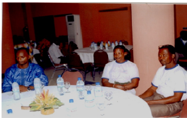
Les représentants des Organisations Paysannes

Le Ministre de l'Agriculture, de l'Elevage et de la Pêche a exprimé l'appréciation du Gouvernement Togolais pour l'effort fourni par la FAO à travers sa Représentation pour accompagner le pays dans l'augmentation de la production agricole, la protection de l'environnement et la amélioration des conditions de vie des populations.