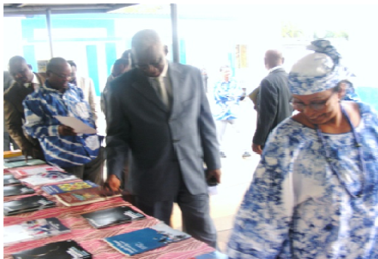
Le Ministre de l'Agriculture, de l'Elevage et de la Pêche et la Représentante a.i. visitant le stand des publications

Des productrices et producteurs des environs de Lomé ont fait le déplacement et ont participé à la journée portes ouvertes. Le Ministre de l'Agriculture, de l'Elevage et de la Pêche a tenu à visiter le Centre des Ressources d'Information (CRI) et à connaître le fonctionnement de la bibliothèque virtuelle.