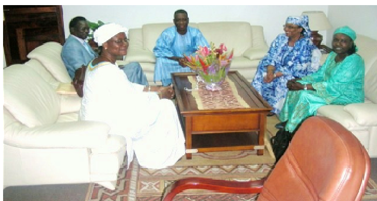
Mesdames la Coordinnatrice du SNU (boubou blanc) et la Représentante de l'UNFPA (boubou vert), et Messieurs les Représentants du HCR (boubou bleu) et de l'ONUSIDA

été organisée le jeudi 16 Décembre 2010 dans l'enceinte de la Représentation sise au 1307, Avenue de Duisburg, Kodjoviakopé à Lomé.