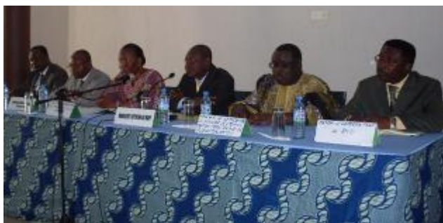
Le présidium à l'ouverture de l'atelier

Le processus d'actualisation du plan stratégique national de prévention et de lutte contre la grippe aviaire, la grippe pandémique humaine et les autres maladies animales prioritaires qui a débuté le 2 Septembre 2010 par la reformulation des objectifs et des résultats attendus du plan stratégique s'est poursuivi au cours de ce mois par l'adoption du document par le Comité technique national lors d'un atelier tenu les 08 et