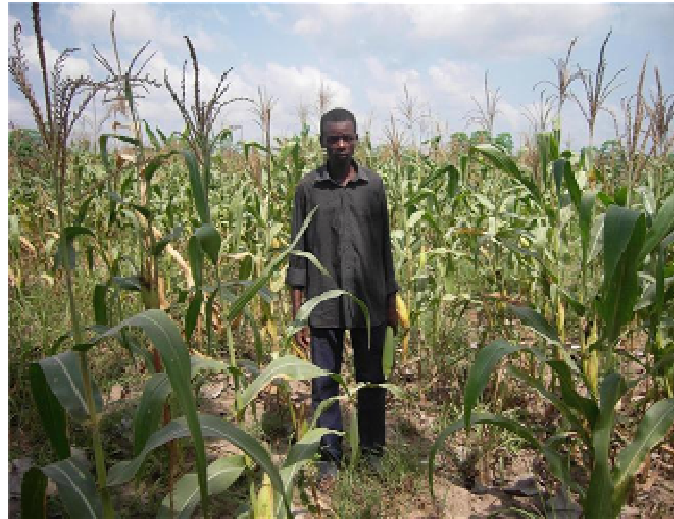
Un producteur de semences dans sa parcelle à Sika-Kondji

Conformément à son programme, la mission a touché 31 villages et visité 30 producteurs individuels et 3 OP. 16 parcelles ont été également inspectées de même que 10