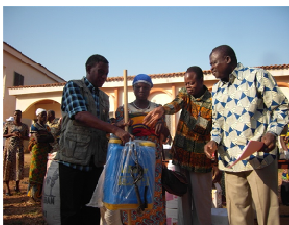
Remise d'un lot à une agricultrice allaitante