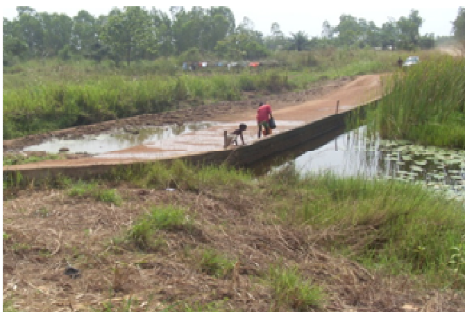
Site de Atti Apédokoe