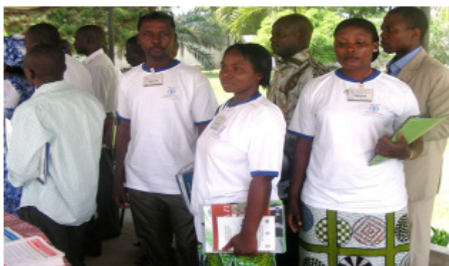
Visite du stand des publications de la FAO par des agricultrices et agriculteurs, bénéficiaires de projets

Des productrices et producteurs des environs de Lomé ont fait le déplacement et ont participé à la journée portes ouvertes. Le Ministre de l'Agriculture, de l'Elevage et de la Pêche a tenu à visiter le Centre des Ressources d'Information (CRI) et à connaître le fonctionnement de la bibliothèque virtuelle.