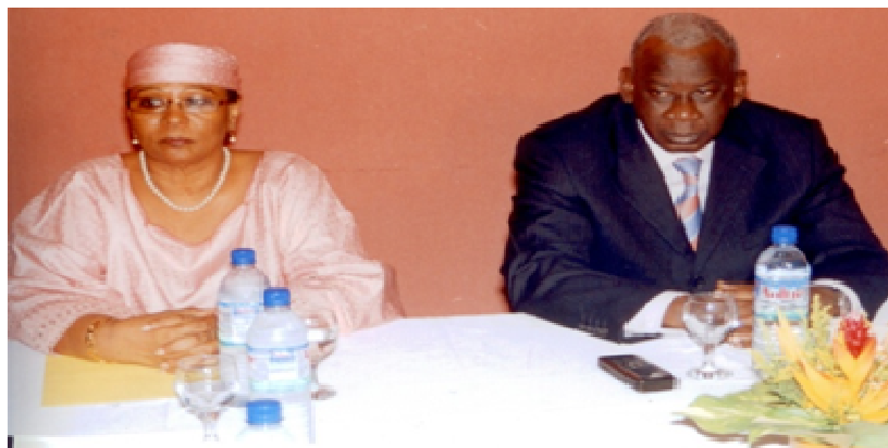
Monsieur le Ministre de l'Agriculture, de l'Elevage et de la Pêche et la Représentante de la FAO a.i