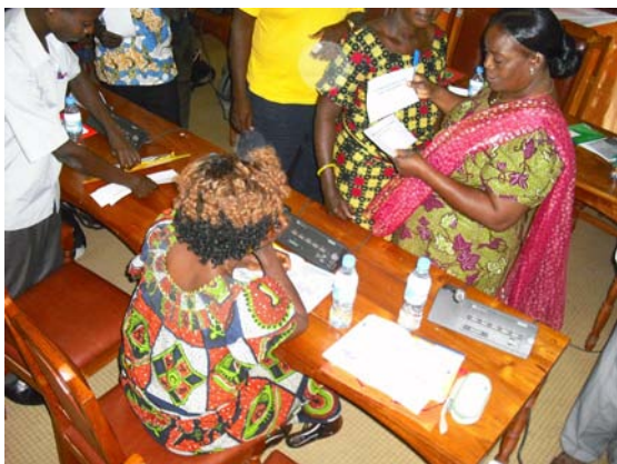
Séance de travaux pratiques en salle

les bonnes pratiques d'élevage avicole, les modalités de prévention de la grippe aviaire par l'application des mesures de biosécurité, les mesures à prendre en cas de suspicion et d'apparition de la grippe aviaire et les méthodes et outils de formation et sensibilisation de son entourage, en s'appuyant sur le manuel du formateur local et la diffusion des brochures.