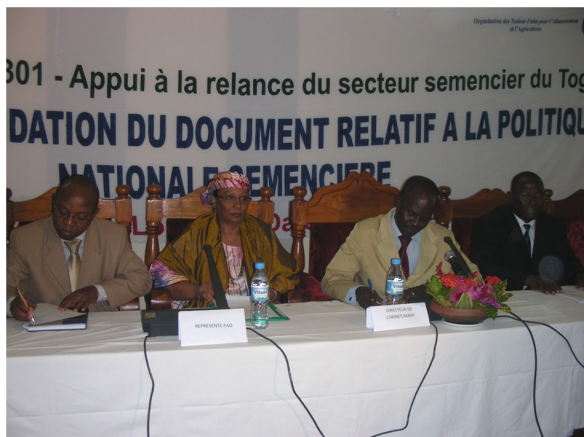
Vue du présidium à l'ouverture de l'atelier

Dans le cadre de la relance de la production agricole, le Ministère de l'Agriculture, de l'Elevage et de la Pêche (MAEP) a initié, avec l'appui de la FAO, un projet "TCP/TOG/3301-Appui à la relance du secteur semencier au Togo". Ce projet vise plusieurs objectifs dont l'élaboration d'une politique nationale semencière assortie d'une stratégie de développement durable du secteur semencier.