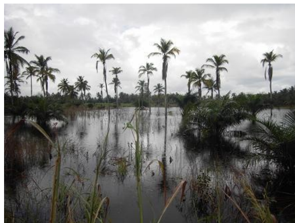
Champ de manioc entièrement inondé