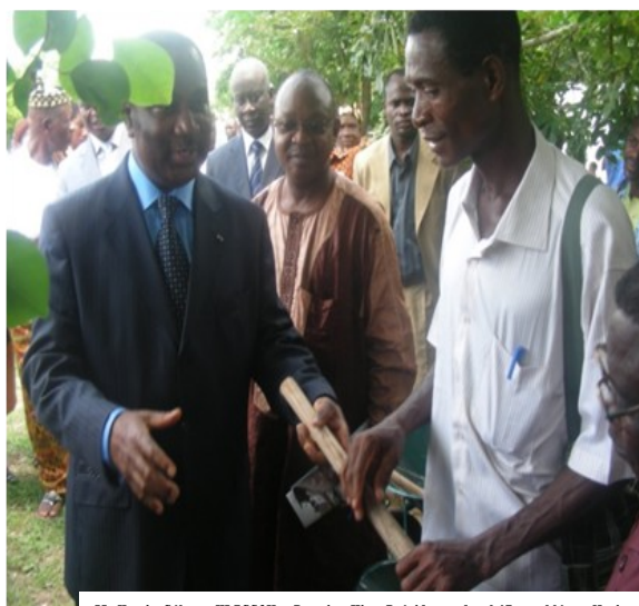
M. Komi Sélo KLASSOU, Premier Vice Président de l'Assemblée Nationale remettant un kit de matériel agricole