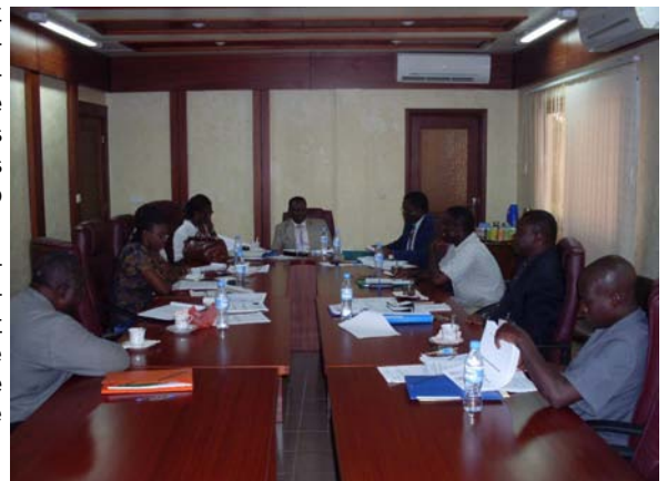
Membres du CEFI en séance de travail dans la salle de conférence de la FAO à Lomé

Enfin, le Comité a fortement recommandé que le compte ouvert soit rapidement alimenté par les fonds prévus sur le projet et que des dispositions soient prises par la Direction de l'élevage pour qu'une ligne budgétaire d'alimentation du fonds soit effective sur budget national en 2011.