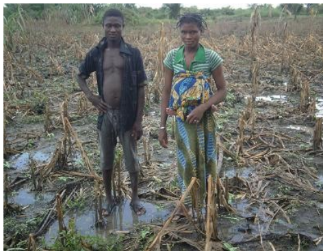
Champ de maïs détruit par les inondations

Lors de la mission, l'équipe a pu s'entretenir avec les chefs d'agence de l'ICAT pour les préfectures des Lacs, du Bas-Mono et du Yoto qui ont fourni des informations chiffrées sur le nombre de personnes touchées et les superficies des cultures inondées. L'équipe a pu aussi visiter le camp des sinistrés à Aklakou, voir le niveau du fleuve Mono à Agomé –