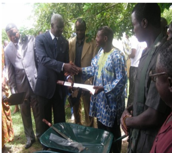
M. Messan Kossi EWOVOR, Ministre de l'Agriculture, de l'Elevage et de la Pêche remettant un kit à un bénéficiaire

Par ailleurs, deux groupements maraîchers travaillant avec le projet d'appui aux ménages agricoles vulnérables financé par l'Union Européenne et exécuté par la FAO ont bénéficié, en plus des appuis du passé, d'une moto pompe, de deux pulvérisateurs, des râpeaux et des arrosoirs. Il s'agit des groupements "Transparence" et "l'Union fait la force".