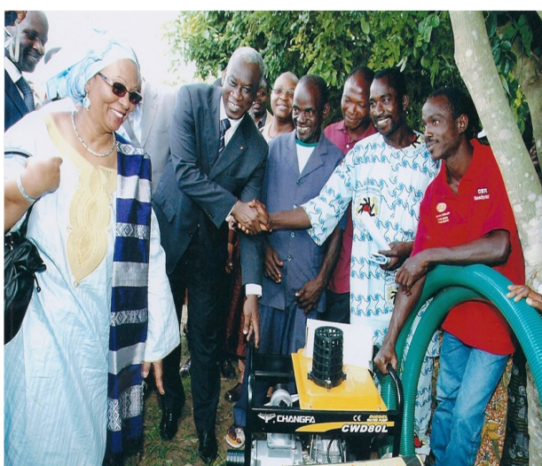
Le Ministre de l'Agriculture et la Représentante de la FAO remettant la motopompe aux deux groupements

Par ailleurs, deux groupements maraîchers travaillant avec le projet d'appui aux ménages agricoles vulnérables financé par l'Union Européenne et exécuté par la FAO ont bénéficié, en plus des appuis du passé, d'une moto pompe, de deux pulvérisateurs, des râpeaux et des arrosoirs. Il s'agit des groupements "Transparence" et "l'Union fait la force".