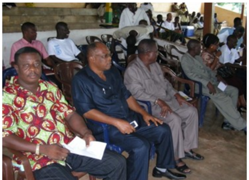
Responsables de l'Administration locale de Notsé

La cérémonie a connu la participation des responsables de l'Administration locale de Notsé, des ONGs, de la population locale et d'un Fonctionnaire de la FAO au Togo