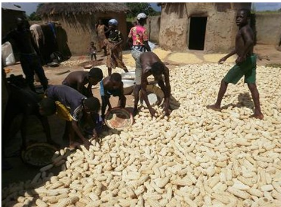
Bénéficiaire et sa famille à Barkoissi (Préfecture de l'Oti) séchant sa récolte de maïs

Des conseils ont été également donnés à tous les bénéficiaires en rapport avec les travaux de récolte et de post récolte et pour une commercialisation efficace d'une partie de leurs récoltes afin d'en tirer pleinement profit pour sécuriser leur alimentation.