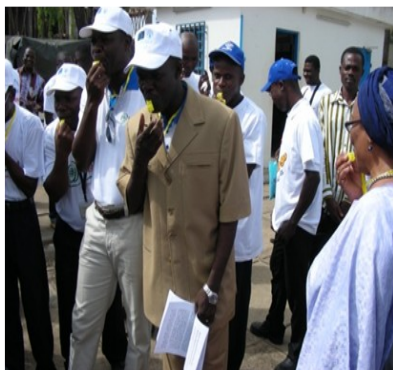
Le Directeur de Cabinet du MAEP et la FAO ai lançant la caravane par un coup de sifflet jaune

L'année 2010 marque la célébration de la trentième Journée Mondiale de l'Alimentation et la quatorzième Opération Telefood massivement observées à travers le monde entier autour du thème "Unis contre la Faim" . Au Togo, diverses manifestations ont été organisées dans le cadre de ces deux événements