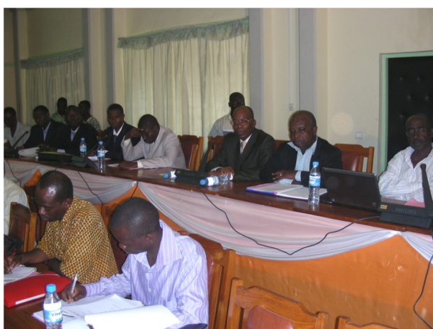
Vue partielle des participants à l'atelier

• Préciser que le réseau national d'informations (observatoire) préconisé doit être mis en place par l'Etat.