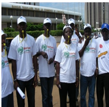
Coups de sifflet jaune à un point d'arrêt de la caravane

Directeur Général de la FAO pour attirer l'attention de l'humanité toute entière sur le sort d'un milliard de personnes qui souffrent de la faim