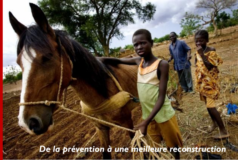
De la prévention à une meilleure reconstruction

Objectif : Cette note d'information résume les actualités saillantes relatives à la crise alimentaire et des moyens d'existence qui pourrait sévir en 2012 dans certaines zones localisées du Burkina Faso, du Mali, de la Mauritanie, du Niger, du Sénégal, du Tchad, et autres pays voisins. Elle analyse l'impact de la situation agricole et pastorale sur la sécurité alimentaire et la vulnérabilité des ménages, et présente la réponse d'urgence de la FAO.