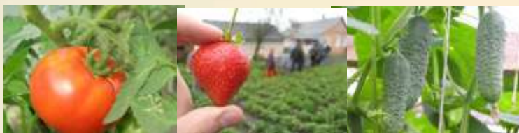
Кооперация мелких с/х производителей в Столинском районе"

Семинар «Кооперация в постсоветских странах»