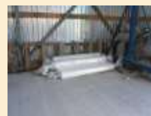
Кооперация мелких с/х производителей в Столинском районе"