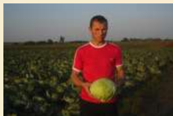
Кооперация мелких с/х производителей в Столинском районе"

Семинар «Кооперация в постсоветских странах»