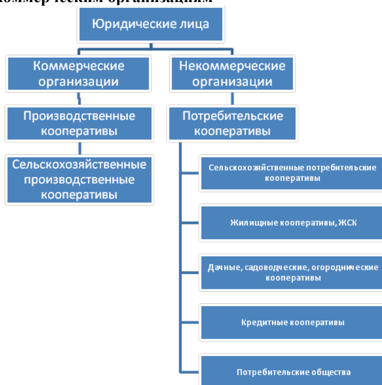
Рисунок 3. Отнесение разных видов сельскохозяйственных кооперативов к коммерческим и некоммерческим организациям

Определение потребительского кооператива в настоящее время содержится в статье 123.2 Гражданского Кодекса РФ: «Потребительским кооперативом признается основанное на членстве добровольное объединение граждан или граждан и юридических лиц в целях удовлетворения их материальных и иных потребностей, осуществляемое путем объединения его членами имущественных паевых взносов».