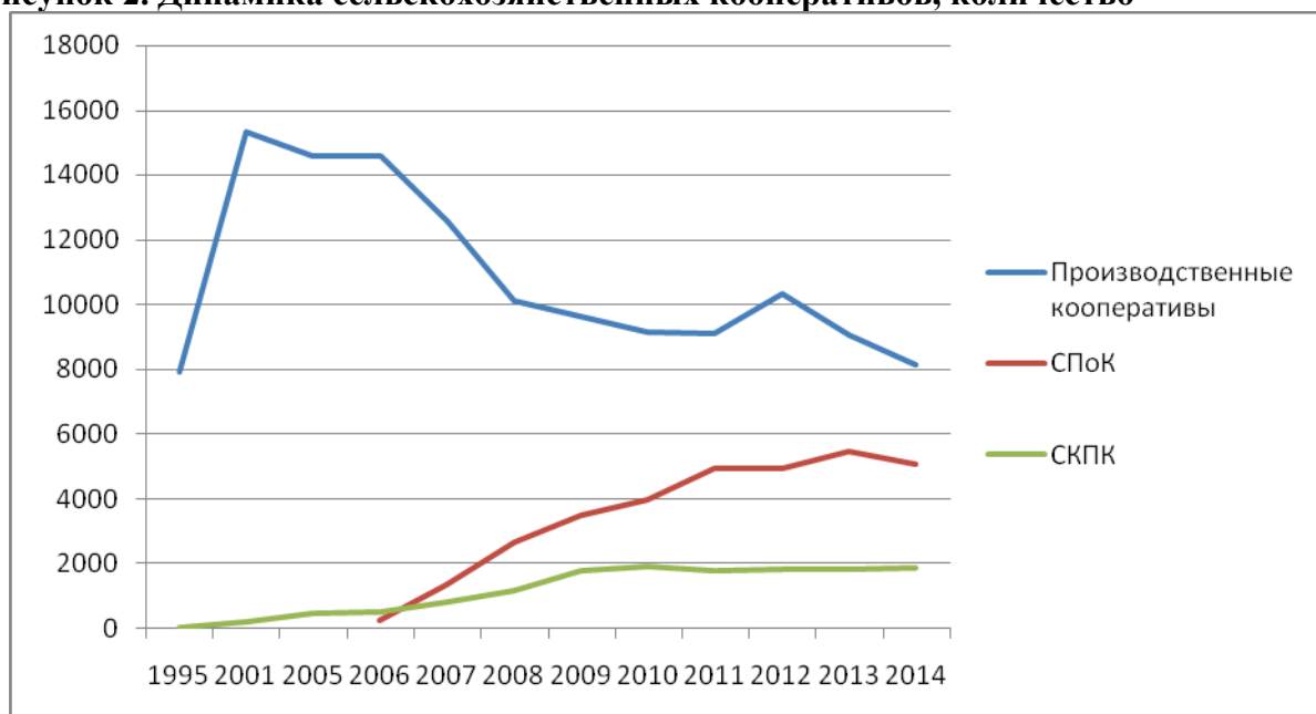
Рисунок 2. Динамика сельскохозяйственных кооперативов, количество

На графике очень хорошо заметно, что бурный рост испытали как раз сельскохозяйственные потребительские кооперативы – СПоК, тогда как сельскохозяйственные кредитные потребительские кооперативы (СКПК) с 1996 года постепенно набирали силу, а численность сельскохозяйственных производственных кооперативов, наоборот, неуклонно снижается 5 .