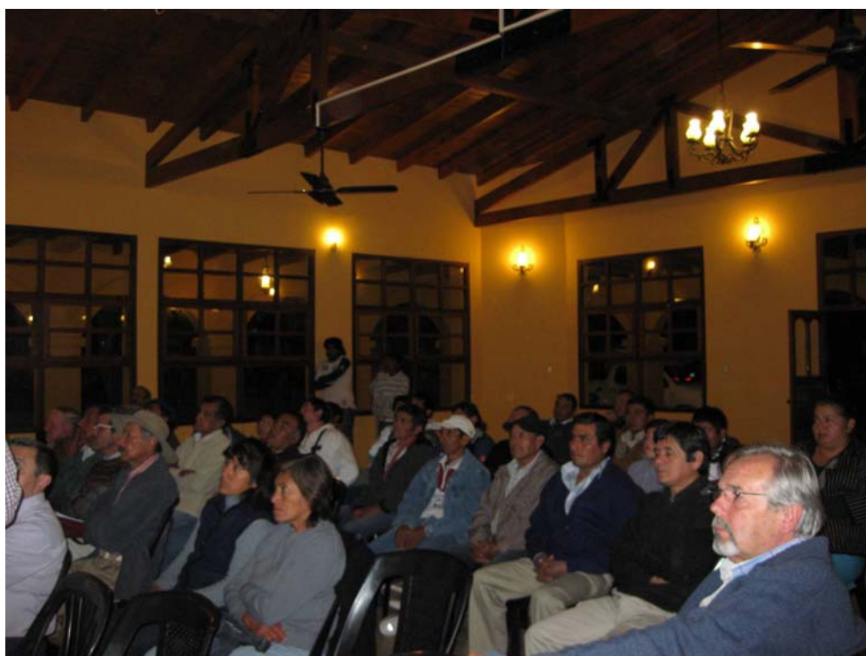
Figura N°1. Foto: productores participando del taller explicativo.