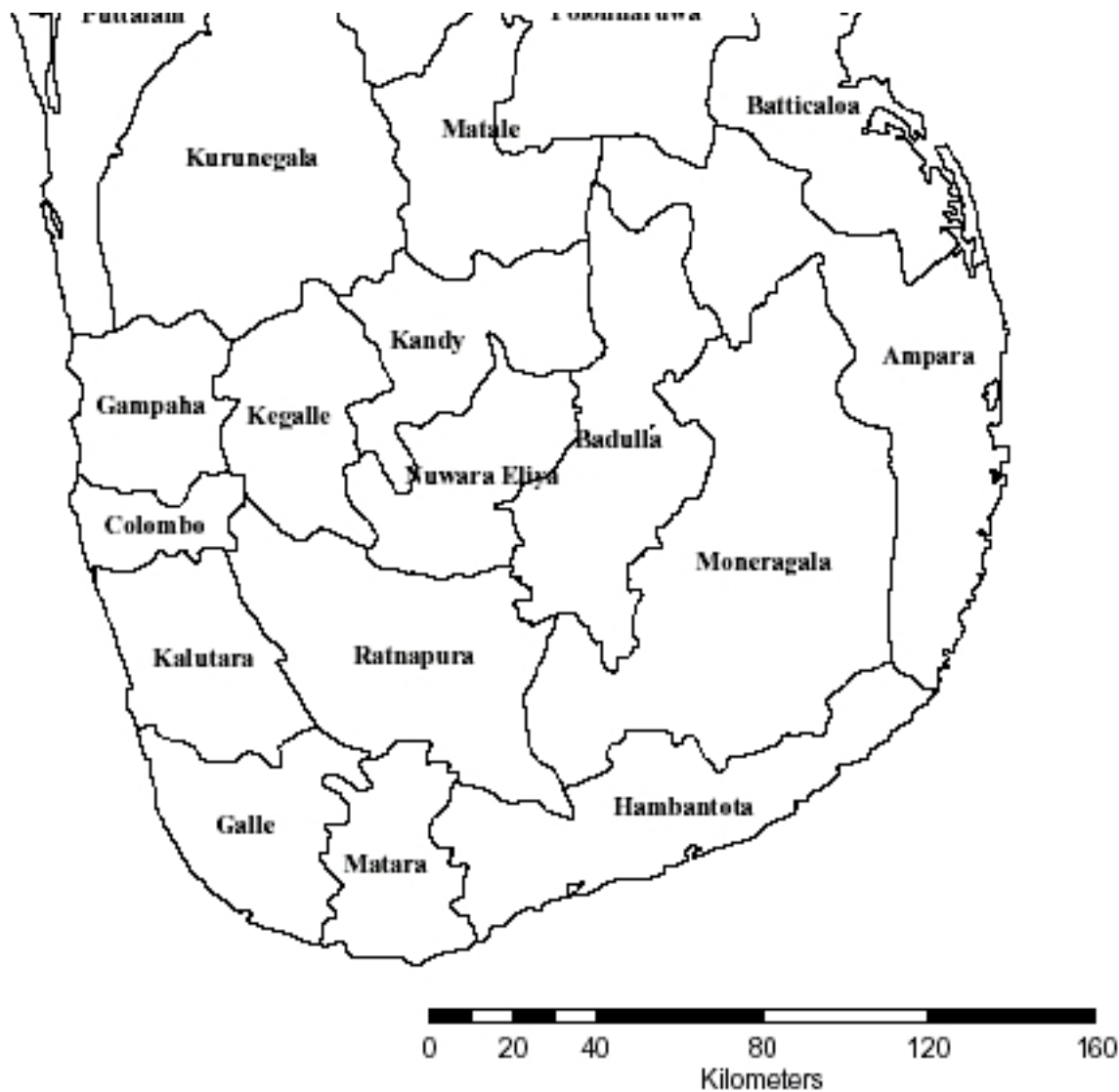
Gráfico 1. Producción pesquera marina en 2004, por Distrito.