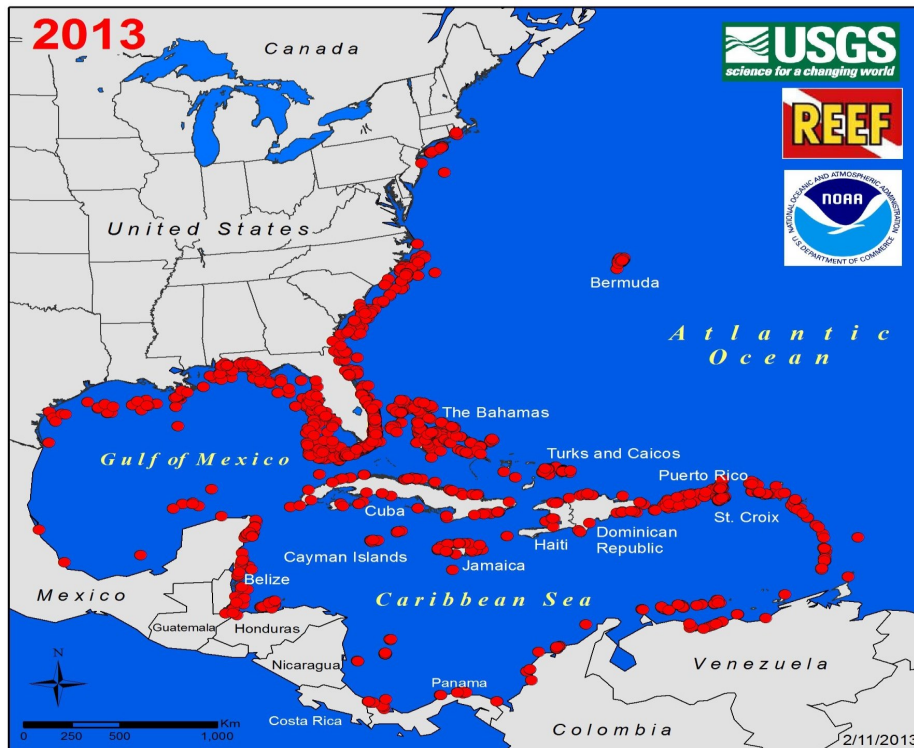
Figure 2. Distribution actuelle du Poisson-lion dans la Caraïbe (actualisée en février 2013) La Floride a été le premier endroit où les poissons-lions ont été documentés dans la région des Caraïbes.

Menace écologique – La prolifération du Poisson-lion dans la Caraïbe au cours des dix dernières années constitue une menace réelle et croissante pour l'écologie des zones marines tropicales et subtropicales de la Grande Région Caraïbe. L'ensemble de la région étant désormais colonisée, les densités de Poissons-lion sur les sites