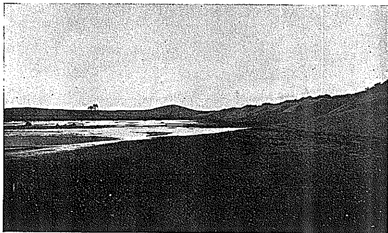
Une dune artificielle fixe.

roduit en Sicile et près de Bône à une époque ancienne et se serait naturalisé dans ces stations? Aucun auteur, en tous cas, à ma connaissance, n'a signalé cette graminée en Tunisie, à l'état spontané.