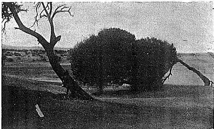
Un lentisque et un filaria, vestiges du maquis qui recouvrait la dune, autrefois. Au fond, des touffes de gourbet.

ment par une population insouciant de lendemain et les dunes qui avaient été fixées par la végétation se sont de nouveau mises en mouvement. Le sable découvert, défoncé, constamment labouré ou bien piétiné par les animaux, a été entraîné par le vent et a formé de nouvelles dunes, mobiles, celles-ci, qui ont enseveli les re-