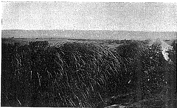
Dunes artificielles et Saccharum Aegyptiacum .

Les jeunes arbres se développent bien et concurrement avec eux, viennent s'installer une foule de végétaux qui, peu à peu, recouvrent toute la surface du sol et finissent par former une pelouse continue. Lorsque les arbres grandiront, ces végétaux seront pour la plupart, étouffés. Il n'y aura plus, alors, que des espèces