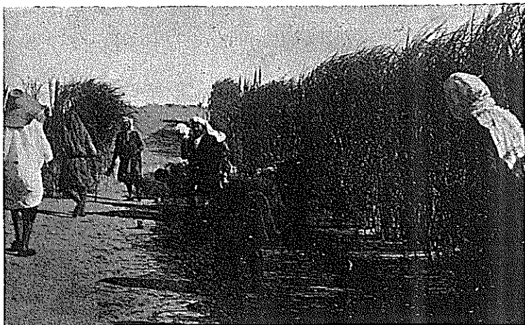
Plantation d'arbres à l'abri de Saccharum de 7 mois.

son passage, piqués dans le sable, ou accrochés aux moindres aspérités du sol, soit des rameaux fructifères entiers, soit des parties d'épis, soit un seul fruit. Ce mode de dissémination donne à la plante un pouvoir colonisateur considérable dans les sables. Lorsque le Salsola Kali se trouve seul, en plein sable, il est grand et robuste.