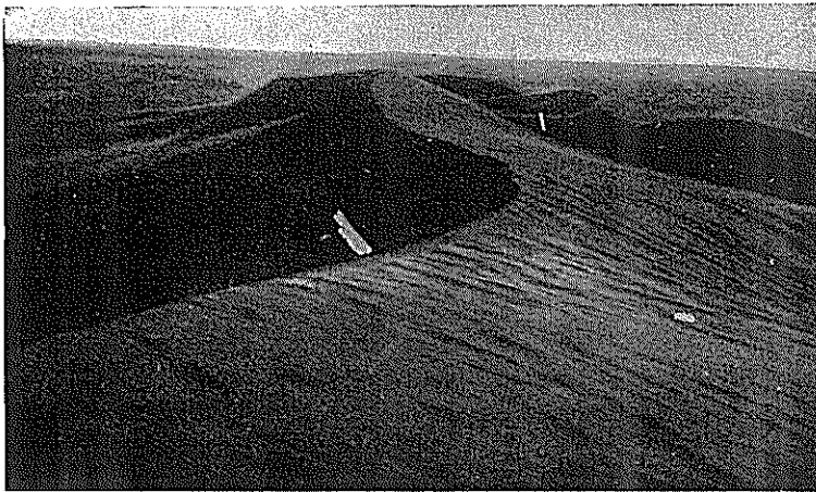
Un aspect des dunes du Cap Bon avant la fixation.

Les sables du Cap Bon formaient autrefois des dunes consolidées, couvertes sur leur plus grande partie par une broussaille continue dont il reste quelques îlots appartenant au groupement de l'olivier-lentisque et se rangeant dans les types de l'« Arbution », du « Cistion »