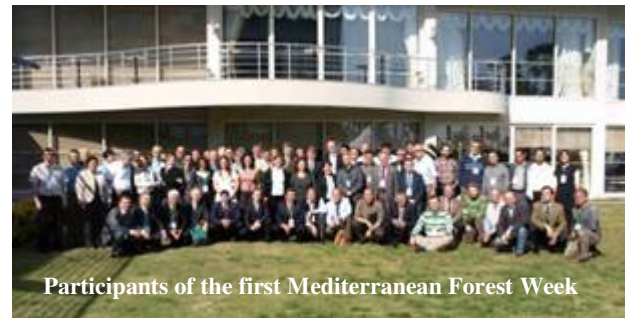
Participants of the first Mediterranean Forest Week