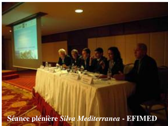
Séance plénière Silva Mediterranea - EFIMED