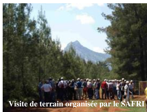
Visite de terrain organisée par le SAFRI