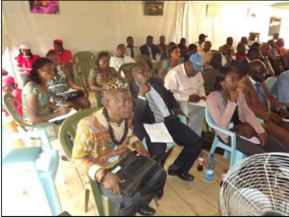
Photo 1. Assistance attentive à un exposé

Un panel représentatif de tous les acteurs du secteur des PFNL a participé à la conférence débat.