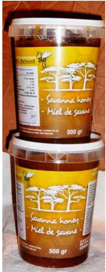
Photo 5 : Pots de miel conditionnés par l'entreprise de transformation Guiding Hope