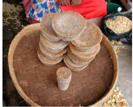
Photo 1 : Amandes de mangue sauvage transformées en tourteaux, en farine et en huile