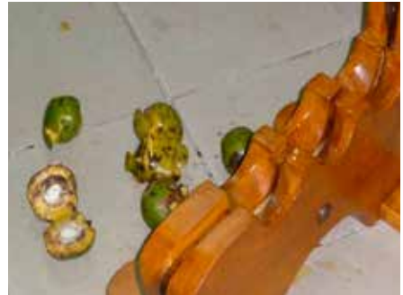
Photo 2 : Technique de transformation : machine à fendre la mangue sauvage