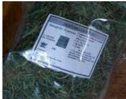
Photo 4 : Okok séché conditionné par l'entreprise de transformation MISPEG au Cameroun