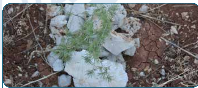
Al-Shouf Cedar Nature Reserve - 2015 Jabal Lubnân, Liban

La composante 1 du projet a également produit une base de données bibliographique a été constituée, qui référence plus de deux cents articles scientifiques et projets – en langue originale – menées dans les territoires forestiers méditerranéens depuis 1990 et étroitement liés au changement climatique. Un outil d'interrogation de cette base de données a été créé, avec un menu qui permet de filtrer les publications par pays, par espèce d'arbre ou par mot-clé. Cet outil a été mis en ligne sur le site web du projet hébergé dans le site de Silva Mediterranea et est désormais opérationnel à l'adresse http://www.fao.org/forestry/89068/en/ . Il a également été présenté au Congrès Forestier Mondial de Durban.