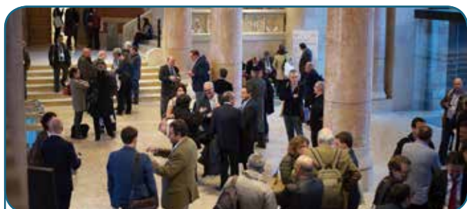
Hôpital de Santa Creu i Sant Pau - 2015 Barcelona, Espagne

La IVe Semaine Forestière Méditerranéenne a également vu la tenue de neuf événements parallèles sur les sujets suivants :