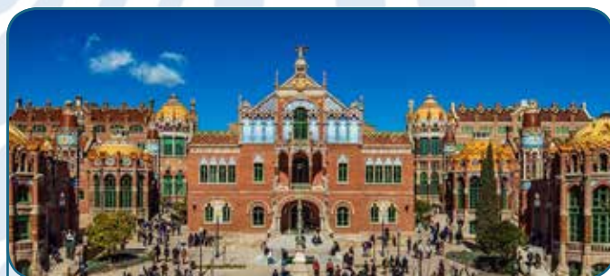
Hôpital de Santa Creu i Sant Pau - 2015 Barcelona, Espagne

Le thème de cette édition a souligné le rôle des forêts méditerranéennes dans la fourniture de biens et services, pour chacune des catégories du Millenium Ecosystem Assessment : services d'approvisionnement (bois énergie, bois d'œuvre, produits forestiers non ligneux, parcours de pâturage, eau potable...); services régulés (atténuation du changement climatique, régulation des inondations...); services culturels (loisirs, tourisme...); services de soutien. La valeur de ces services est paradoxalement rarement reconnue. Pourtant, comme souligné lors de la première session