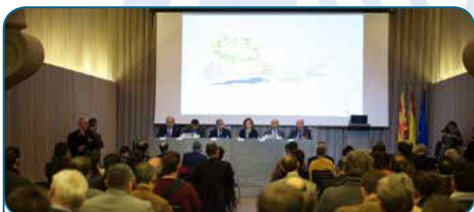
Hôpital de Santa Creu i Sant Pau - 2015 Barcelona, Espagne

En marge de la IVe Semaine Forestière Méditerranéenne et tirant parti du rassemblement d'un grand nombre d'acteurs de la forêt méditerranéenne, plusieurs réunions de projets, de comité ou de groupes de travail se sont tenues.