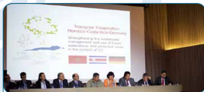
Hôpital de Santa Creu i Sant Pau - 2015 Barcelona, Espagne