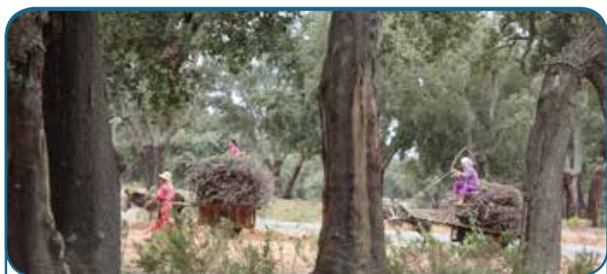
Forêt de la Maâmora - 2015 Kenitra, Maroc

La composante 1 de ce projet régional financé par le Fonds Français pour l'Environnement Mondial (FFEM) a tenu son atelier final du 13 au 15 janvier 2015 à Antalya en Turquie. La composante 1 a pour objectif de produire des données et d'élaborer des outils d'aide à la décision et à la gestion en matière de vulnérabilité des écosystèmes forestiers méditerranéens aux effets du changement climatique et en matière de capacité d'adaptation de ces écosystèmes forestiers. Sur chacun des sites pilote retenus pour cette composante du projet – à savoir Siliana en Tunisie, la Maâmora au Maroc, Jabal Moussa au Liban, Senalba en Algérie et Düzlerçamı en Turquie – une analyse de vulnérabilité de l'écosystème forestier aux impacts du changement climatique a été réalisée selon une méthode commune, la modélisation spatiale multifactorielle. Les résultats de ces analyses de vulnérabilité ont été consignés dans des rapports.