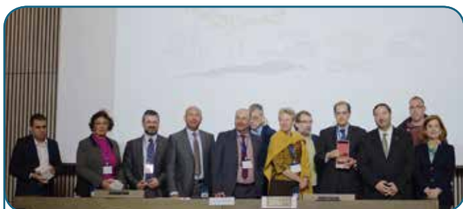
Hôpital de Santa Creu i Sant Pau - 2015 Barcelona, Espagne

Les projets COST Action FP1204 « L'approche de l'Infrastructure Verte : lier les aspects environnementaux et sociaux dans l'étude et la gestion des forêts urbaines » et MEDFORVAL (« Réseau de territoires boisés à haute valeur écologique ») ont ainsi tenu des réunions, de même que le groupe d'experts de l'Union Européenne sur les feux de forêt, le groupe de travail n° 7 de Silva Mediterranea sur les forêts urbaines et péri-urbaines, et les présidents de fédération de propriétaires forestiers du sud de l'Europe. En rassemblant des acteurs aussi bien des sphères des décideurs politiques, des bailleurs de fonds, des services forestiers et des propriétaires forestiers, des organisations environnementales, des experts scientifiques et techniques forestiers, et des experts des secteurs connexes à la foresterie (eau, tourisme, agriculture, énergie), la IVe Semaine Forestière Méditerranéenne a tenu ses promesses de plateforme d'échanges sur les forêts méditerranéennes.