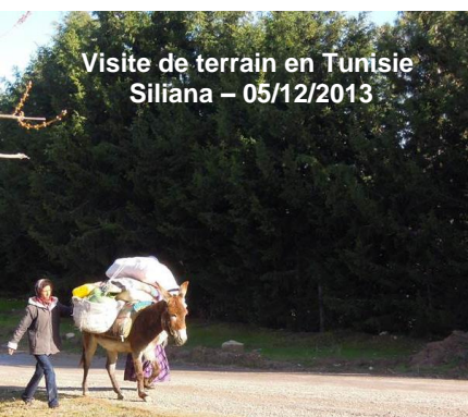
Visite de terrain en Tunisie Siliana – 05/12/2013