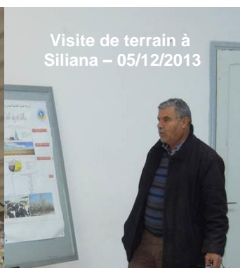
Visite de terrain à Siliana – 05/12/2013