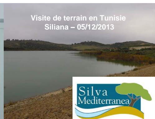
Visite de terrain en Tunisie Siliana – 05/12/2013