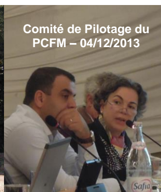
Comité de Pilotage du PCFM – 04/12/2013