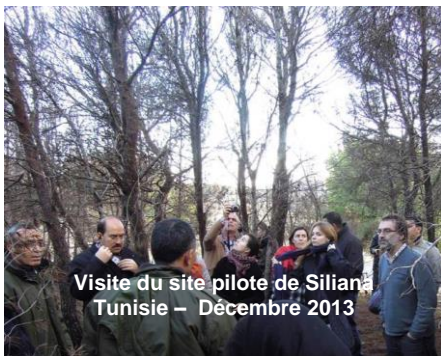
Visite du site pilote de Siliana Tunisie – Décembre 2013

Le dernier arrêt était au cœur du massif forestier de Siliana, qui couvre une surface d'environ 140 000 hectares et comprend essentiellement des Pin d'Alep, du maquis et des garrigues, ainsi que du Romarin.