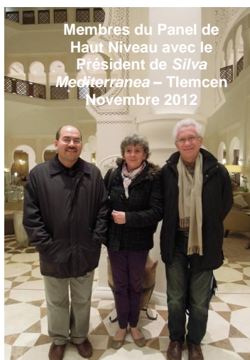
Membres du Panel de Haut Niveau avec le Président de Silva Mediterranea – Tlemcen Novembre 2012