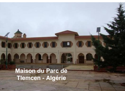
Maison du Parc de Tlemcen - Algérie