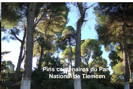
Pins centenaires du Parc National de Tlemcen