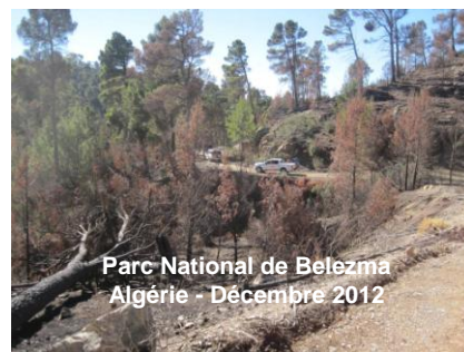
Parc National de Belezma Algérie - Décembre 2012

L'excursion dans le Parc National de Belezma (Aurès - Batna) a été une excellente occasion d'observer l'impact d'un récent feu qui a dévasté pendant plusieurs jours une forêt de pins (Août 2012). Cette visite de terrain a également été une bonne opportunité pour observer l'ampleur des dépérissements dans la forêt de cèdres du Parc National de Belezma.