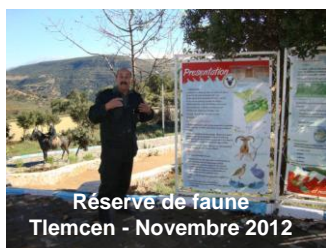
Réserve de faune Tlemcen - Novembre 2012

Environ 25 participants ont assisté à ces réunions avec des représentants d'Algérie, du Liban, du Maroc, de Tunisie, de Turquie, du Plan Bleu, du Comité des Questions Forestières Méditerranéennes-Silva Mediterranea de la FAO, de la Coopération Allemande (GIZ), de l'Association Internationale Forêts Méditerranéennes (AIFM), de l'Agence Française de Développement (AFD), du Centre Technologique Forestier de Catalogne (CTFC), du Centre International de Hautes Etudes Agronomiques Méditerranéennes (CIHEAM), du Mécanisme Mondial de la