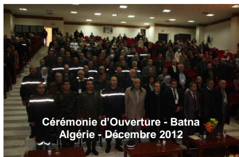
Cérémonie d'Ouverture - Batna Algérie - Décembre 2012

L'atelier était supporté par les partenaires suivants: