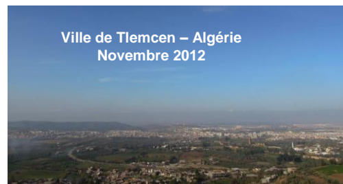
Ville de Tlemcen – Algérie Novembre 2012

Après avoir partagé des propositions et impressions avec les participants, le Comité Exécutif Élargi de Silva Mediterranea a approuvé les principales étapes suivantes pour l'année 2013 :