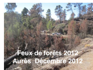
Feux de forêts 2012 Aurès Décembre 2012

sur le lancement des travaux du panel de Haut Niveau mis en place pour l'évaluation des groupes de travail de Silva Mediterranea. A cette occasion, les membres du panel d'évaluation ont clarifié avec les membres du Comité Exécutif les principales étapes pour l'année 2013 (Cf. article page 4).