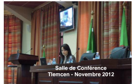
Salle de Conférence Tlemcen - Novembre 2012

La vidéo sera largement distribuée aux médias (nationaux et internationaux) et, également, disponible sur les sites Internet des principaux partenaires techniques et financiers impliqués dans l'organisation de cette III SFM (agences régionales et mondiales).