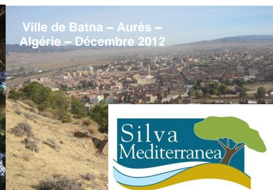
Ville de Batna – Aurès – Algérie – Décembre 2012