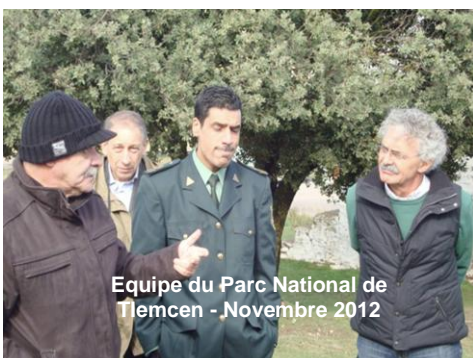
Equipe du Parc National de Tlemcen - Novembre 2012

Un objectif important du Comité d'Organisation de cette III SFM est d'organiser un "événement vert". Les pratiques éco-responsables à mettre en œuvre tout au long de la III SFM ont donc largement été discutées. Dans ce cadre il a été décidé de mettre en place une compensation des émissions de carbone à travers une plantation de deux hectares dans le Parc National de Tlemcen. Il a aussi été convenu de produire une quantité minimum de documents papier. "L'État des Forêts Méditerranéennes", qui sera pour la première fois présenté lors de la III SFM, ne sera donc disponible que dans un format numérique (PDF) et téléchargeable sur les sites Internet de la FAO et du Plan Bleu.