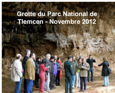
Grotte du Parc National de Tlemcen - Novembre 2012

Au terme des travaux le plan de travail 2013 - 2014 du PCFM a été approuvé. Il a également été convenu de mener une évaluation du Partenariat de Collaboration sur les Forêts Méditerranéennes pour la période 2010-2013.