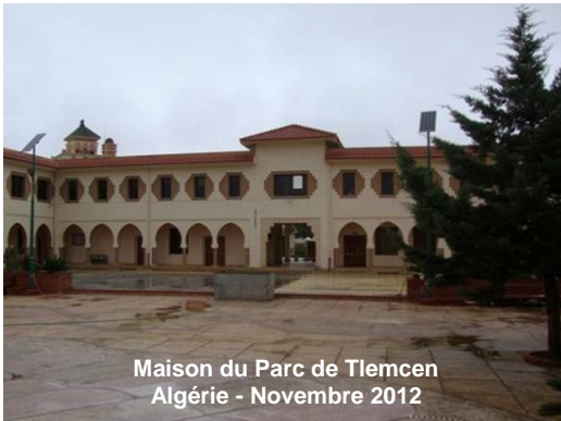
Maison du Parc de Tlemcen Algérie - Novembre 2012

La quatrième réunion du Comité d'Organisation de la Troisième Semaine Forestière Méditerranéenne (III SFM) a été l'occasion de discuter les questions suivantes : la stratégie de communication avec les médias, les termes de référence pour plusieurs sessions de la III SFM, le déroulé de la visite de terrain prévue le mercredi 20 mars 2013 et l'organisation du segment ministériel programmé à la fin de la conférence le jeudi 21 mars 2013.