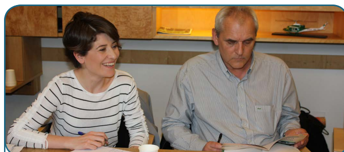
1 ère rencontre des collaborateurs de l'EdFM - 2016 Rome, Italie

La FAO et le Plan Bleu prépareront les termes de référence pour chaque chapitre. Certains coordinateurs de chapitre ont déjà été sélectionnés, mais d'autres experts pour la coordination ou la corédaction de tous les chapitres doivent encore être trouvés.