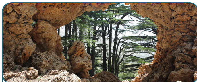
Becharré Forêt de cèdre- 2015 Liban Nord, Liban

Suivant l'exemple de nombreux engagements pris à l'échelle globale ou régionale à travers des initiatives existantes (le défi de Bonn, l'initiative 20x20 en Amérique latine, l'« Initiative sur la restauration des forêts en