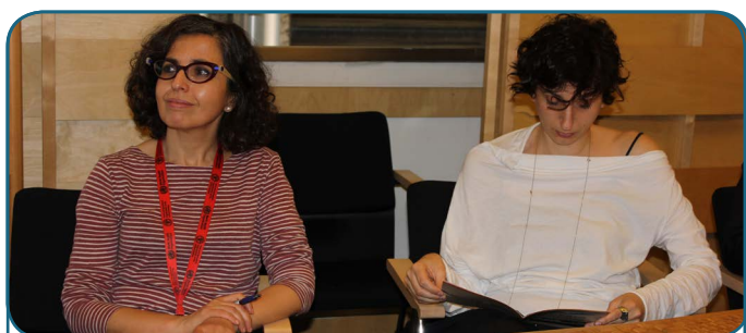
1 ère rencontre des collaborateurs de l'EdFM - 2016 Rome, Italie

La première réunion du Comité d'Organisation (CO) de la Cinquième Semaine Forestière Méditerranéenne (V SFM) s'est tenue du 30 au 31 mars 2016 à Rabat, au Maroc. Cette première réunion avait pour but de faire un débriefing de la précédente édition de la Quatrième Semaine Forestière Méditerranéenne, d'établir les objectifs (thématiques) et d'établir le comité d'organisation. La structure de la Semaine (sessions), le budget, les tâches assignées aux partenaires et tous les autres aspects liés à l'organisation de la V SFM ont également été discutés.