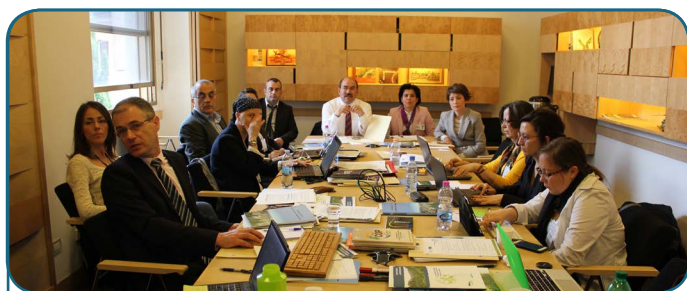
6 ème réunion du CEE de Silva Mediterranea - 2016 Rome, Italie

La sixième réunion du Comité Exécutif Elargi de Silva Mediterranea s'est tenue au siège de la FAO à Rome le vendredi 8 avril 2016. Suite aux décisions de l'évaluation de 2013 de Silva Mediterranea , la réunion avait pour but de commencer à définir une stratégie spécifique pour Silva Mediterranea et à assurer la cohérence entre les activités des groupes de travail de Silva Mediterranea et cette stratégie. Cette réunion avait également pour objectif d'établir des synergies entre les groupes de travail et de renforcer la mobilisation des agents de la FAO dans les activités des groupes.