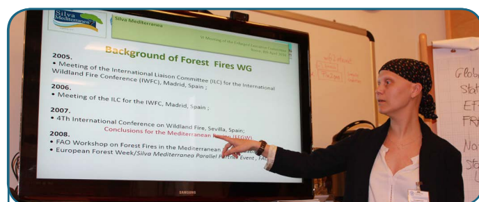
6 ème réunion du CEE de Silva Mediterranea - 2016 Rome, Italie

De plus, les objectifs des différents groupes doivent être mieux communiqués aux partenaires de Silva Mediterranea et doivent être inclus dans la stratégie. Les plans de travail des groupes de travail ainsi que la stratégie de Silva Mediterranea doivent être accompagnés d'un outil de suivi. Cet outil de suivi doit être complété en permanence avec des informations et des commentaires transmis par les coordinateurs des groupes de travail (par exemple, l'ouverture d'une plate-forme web comme Dgroups). Ce travail devrait renforcer la collaboration entre les groupes de travail. Des réunions régulières (une fois par an, par exemple) du Comité Exécutif sont nécessaires afin d'évaluer les progrès dans les plans d'action des groupes de travail.