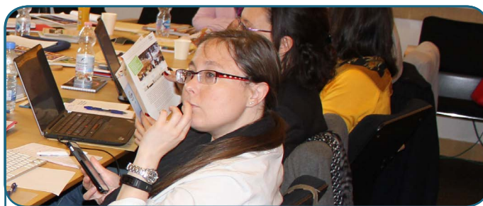
1 ère rencontre des collaborateurs de l'EdFM - 2016 Rome, Italie

Suite au succès de la première édition de l'État des Forêts Méditerranéennes (EdFM) lancée en 2013 lors de la troisième Semaine Forestière Méditerranéenne, une deuxième édition de l'EdFM est en train d'être rédigée.