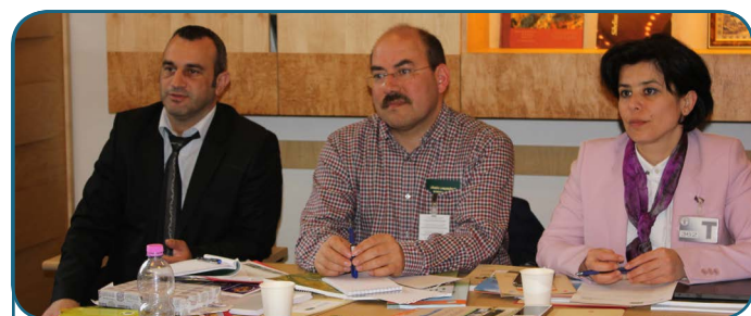
6 ème réunion du CEE de Silva Mediterranea - 2016 Rome, Italie @C. Marchetta