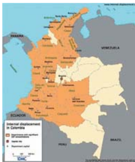
Mapa 2. Localización del desplazamiento interno en Colombia. 2005

No obstante, existen departamentos que por su características geoestratégicas resultan tener un mayor protagonismo. Así, en cuanto al mayor volumen de personas desplazadas destacan siete (7) de los treinta y dos (32) 16 departamentos en que se divide el país. Cada uno de ellos representa más de un 5% del total de desplazados durante el período analizado (2003-2007), en total el 30,2%; y son por este orden: Antioquia, seguido de Caquetá, Bolívar, César, Tolima y Meta.