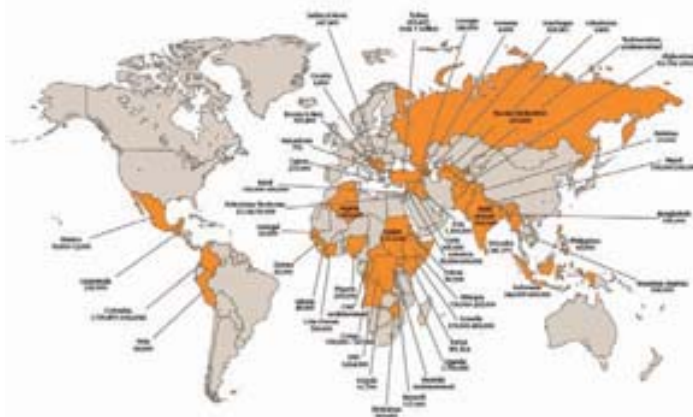
Mapa 1. Desplazamiento interno en el mundo. 2005

Fuente: IDMC (2006) Internal Displacement: A Global Overview of Trends and Developments in 2005 . Nota: Los datos responden a la fuente utilizada en cada país. En el caso de Colombia la primera cifra responde al recuento de la Red de Solidaridad Social —datos acumulados desde 1994— y la segunda a la del CODHES —datos acumulados desde 1985—.