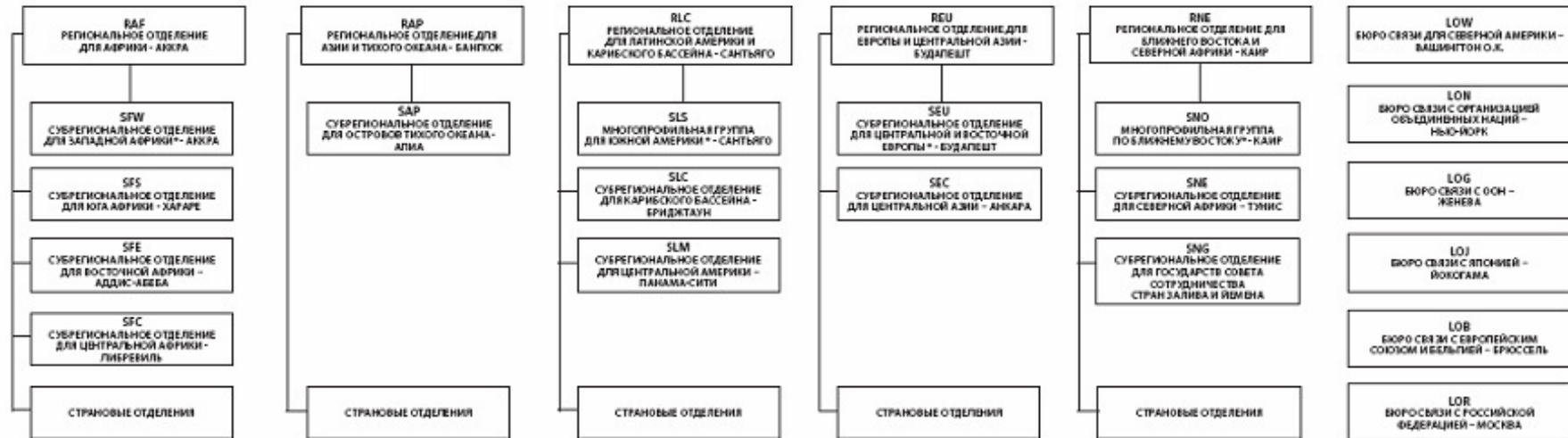
Диаграмма 2: Структура децентрализованных отделений