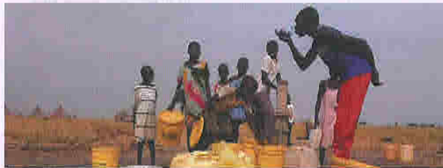
Soudan. L'eau est au cœur des préoccupations.