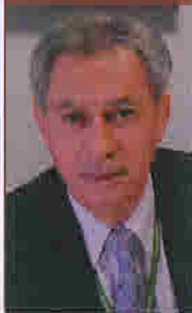
Pasquale Steduto Directeur adjoint de la Division Terre-et-eau de l'Organisation des Nations Unies pour l'alimentation et l'agriculture (FAO)

«Sans eau, il est simplement impossible de parvenir à la sécurité alimentaire.»