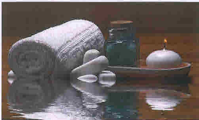
RELAXE: Les SPA, remède contre le stress.

La moitié des travailleurs helvètes sont stressés par leur travail et leur rythme de vie. Mais aujourd'hui, il existe un moyen simple et rapide pour prendre soin de soi: le SPA en ville.