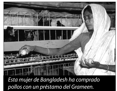
Esta mujer de Bangladesh ha comprado pollos con un préstamo del Grameen.

Casi todos los prestatarios son mujeres, que suelen ser más pobres y disponer de menos recursos que los hombres. El Grameen ha permitido a más de 700 000 mujeres superar el umbral de pobreza y presume de una de las mejores tasas de reembolso de los préstamos, con un promedio de más del 90 por ciento. El Grameen sirve ahora de modelo en 43 países para programas que prestan servicios a 8 millones de personas.