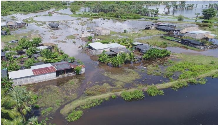
Prensa Libre 2017

Inundaciones, tormentas, huracanes y contaminaciones por actividades agrícolas.