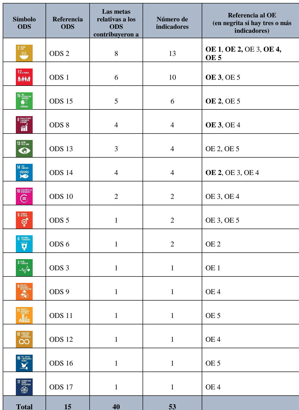
Figura 1: Metas e indicadores relativos a los ODS incluidos en el marco de resultados para 2018-2021 en relación con los objetivos estratégicos