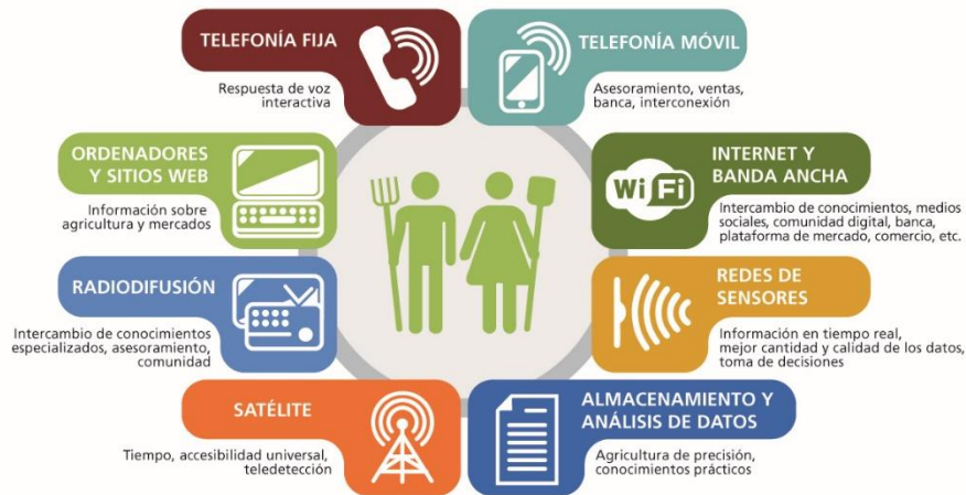
Figura 1: Las TIC en la agricultura

2. La ciberagricultura comprende el diseño, la elaboración y la aplicación de formas innovadoras de usar las tecnologías de la información y la comunicación (TIC) en el ámbito rural, centrándose principalmente en la agricultura y la alimentación, incluidas la pesca, la actividad forestal y la ganadería. La aplicación tecnológica, la facilitación, el apoyo mediante normas, el fomento de la capacidad, la educación y la divulgación pertenecen al concepto más amplio de ciberagricultura (Figura 1). La definición va más allá del aspecto de la agricultura relacionado con la administración pública electrónica, puesto que no solo incluye los servicios agrícolas prestados por los gobiernos a los ciudadanos (por ejemplo, a los agricultores y las comunidades rurales) por medio de las TIC, sino que también engloba toda una serie de productos, servicios e infraestructuras proporcionados por gobiernos, el sector privado, organizaciones de investigación pública y extensión, organizaciones no gubernamentales, organizaciones de agricultores y organizaciones intergubernamentales.