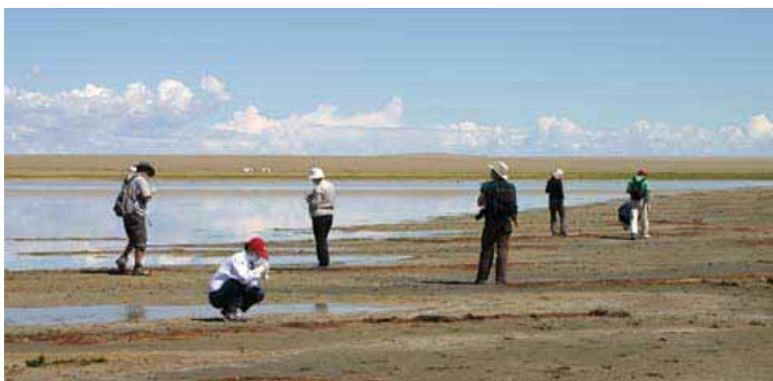
Echantillonnage d'oiseaux sauvages en Mongolie (Août 2005)