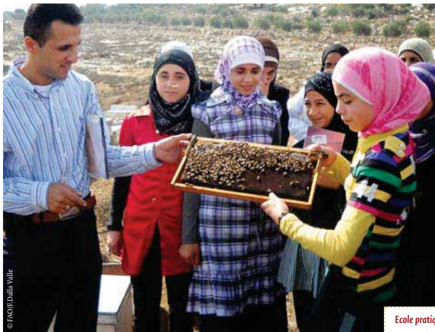
Ecole pratique d'agriculture et de vie pour les jeunes, Hébron, Cisjordanie.

Dans le processus d'apprentissage des JFELS, qui est adapté par les facilitateurs en fonction des circonstances climatiques et socio-culturelles, l'accent est mis sur l'apprentissage par la pratique. Un lien constant est établi entre le cycle agricole et le cycle de vie. L'approche des JFELS se fonde sur un processus d'apprentissage basé sur l'expérience qui encourage le groupe à observer, à tirer des conclusions et à prendre des décisions cohérentes avec les bonnes pratiques agricoles et de vie en connaissance de cause. Sur le terrain, cela implique que les participants analysent les problèmes relatifs à la culture des récoltes, dans le cadre de leur analyse des problèmes auxquels ils sont confrontés dans leur propre vie. Dans les JFELS, les participants analysent les moyens de subsistance et les problèmes sociaux, et discutent des résultats avec leurs pairs grâce au théâtre, au jeu et à d'autres méthodes. Dans des situations où les enfants n'ont qu'un accès très limité à l'information et aux équipements, l'attitude consistant à aider ces enfants à jouer, penser, discuter et se servir des ressources locales pour résoudre leurs problèmes favorise leur autonomisation et accroît leur estime d'eux-mêmes.