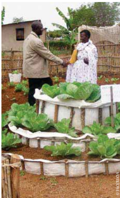
Potager au Rwanda.