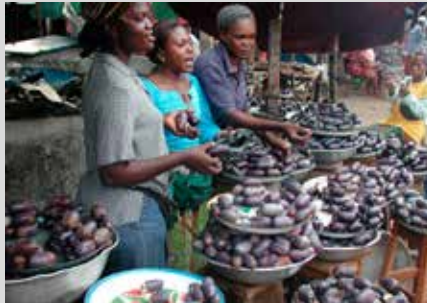
Femmes vendant des safoutiers ( Dacryodes edulis ) sur le marché de Makénéne dans la région du Centre

Le safou ( Dacryodes edulis ) est l'un des PFNL les plus exploités au Cameroun et en RDC. Il est vendu frais en Afrique centrale et de plus en plus souvent sous forme séché en sachets, à destination de l'Europe et de l'Amérique du Nord. Alors que les femmes contrôlent le marché de détail et les hommes la majeure partie des marchés d'export, Esther Foungong s'est forgé un nom dans le commerce de gros vers le Gabon. Elle a commencé dans la