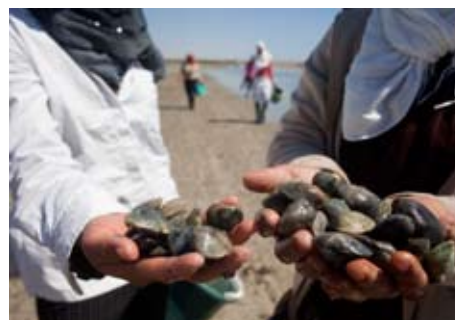
Un projet de la FAO aide des Tunisiennes à gagner leur vie en récoltant des palourdes.

En 1995, les États membres de la FAO ont adopté le Code de conduite pour une pêche responsable, qui énonce les principes et méthodes applicables à tous les aspects des pêches et de l'aquaculture. Le Code indique des moyens de développer et de gérer les pêches et l'aquaculture. La FAO a mis au point quatre plans d'action internationaux visant à soutenir la pêche responsable, portant sur les oiseaux marins, les requins, la capacité de pêche et la pêche illicite, non déclarée et non réglementée (IUU). Deux stratégies spéciales ont été conçues pour améliorer la collecte de données et les systèmes de surveillance, tant pour les pêches de capture que pour l'aquaculture. Une série de directives techniques vise à faciliter la mise en application des principes du Code.