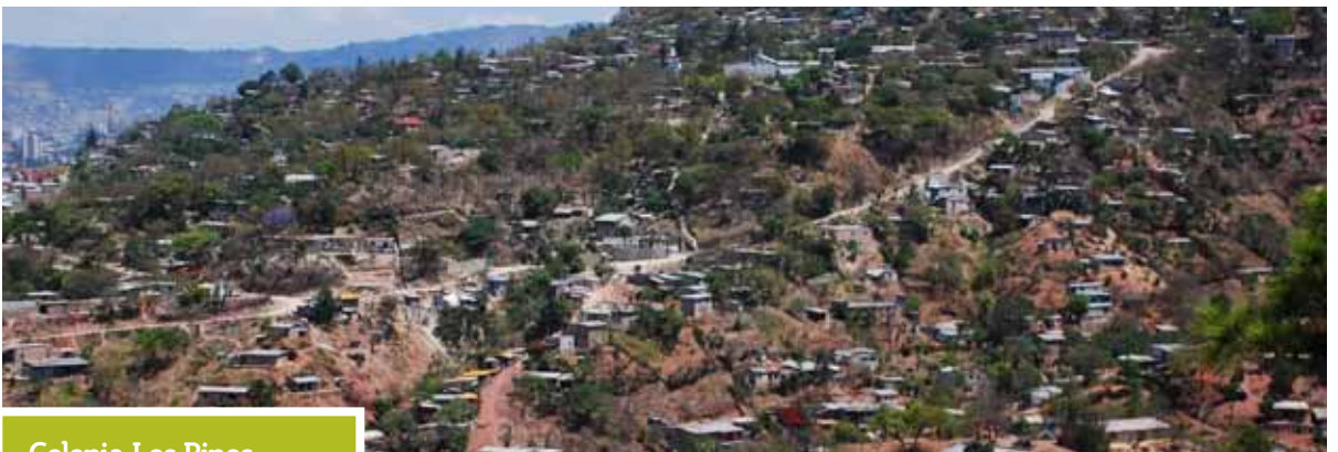
Colonia Los Pinos