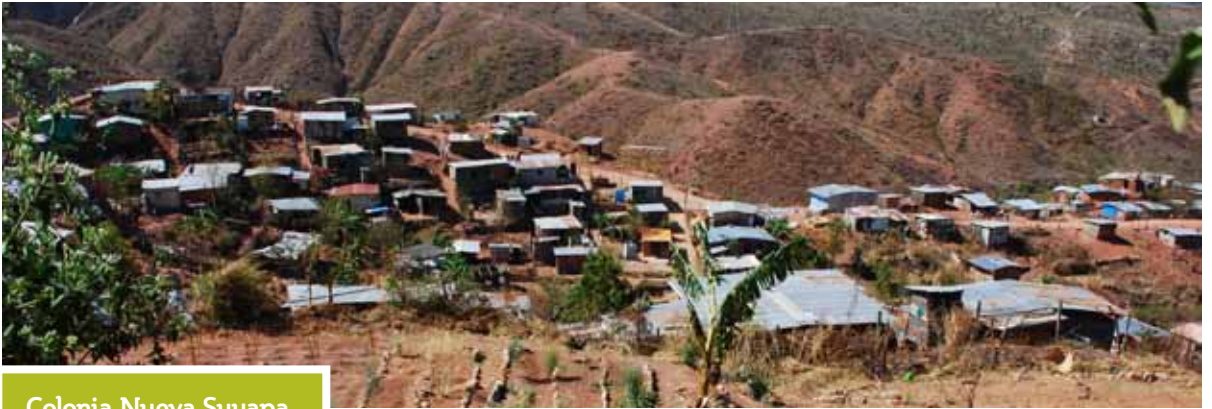
Colonia Nueva Suyapa