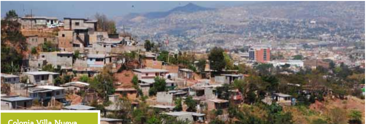
Colonia Villa Nueva