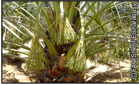
طريقة الخف بقص اطراف الشماريخ

ويتم إزالة بعض السباط بكاملها خاصة في حالة حملها لعدد كبير أكبر من حجم الشجرة وذلك للوصول إلى عدد محدد حسب الصنف وعموماً يراعى عند الإزالة الأخذ بالترتيب التالي: