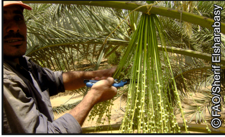
كيفية إزالة قلب الشماريخ