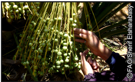
إزالة الثمار بالنظام التبادلي على الشماريخ