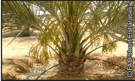
منظر عام بعد إزالة القلب والأطراف