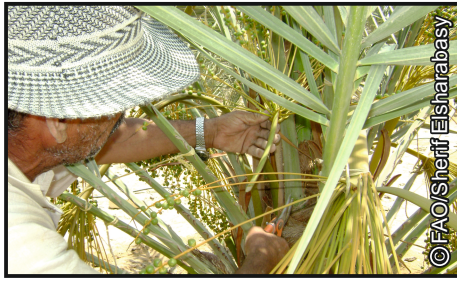
طريقة الخف بقص قلب السباطة