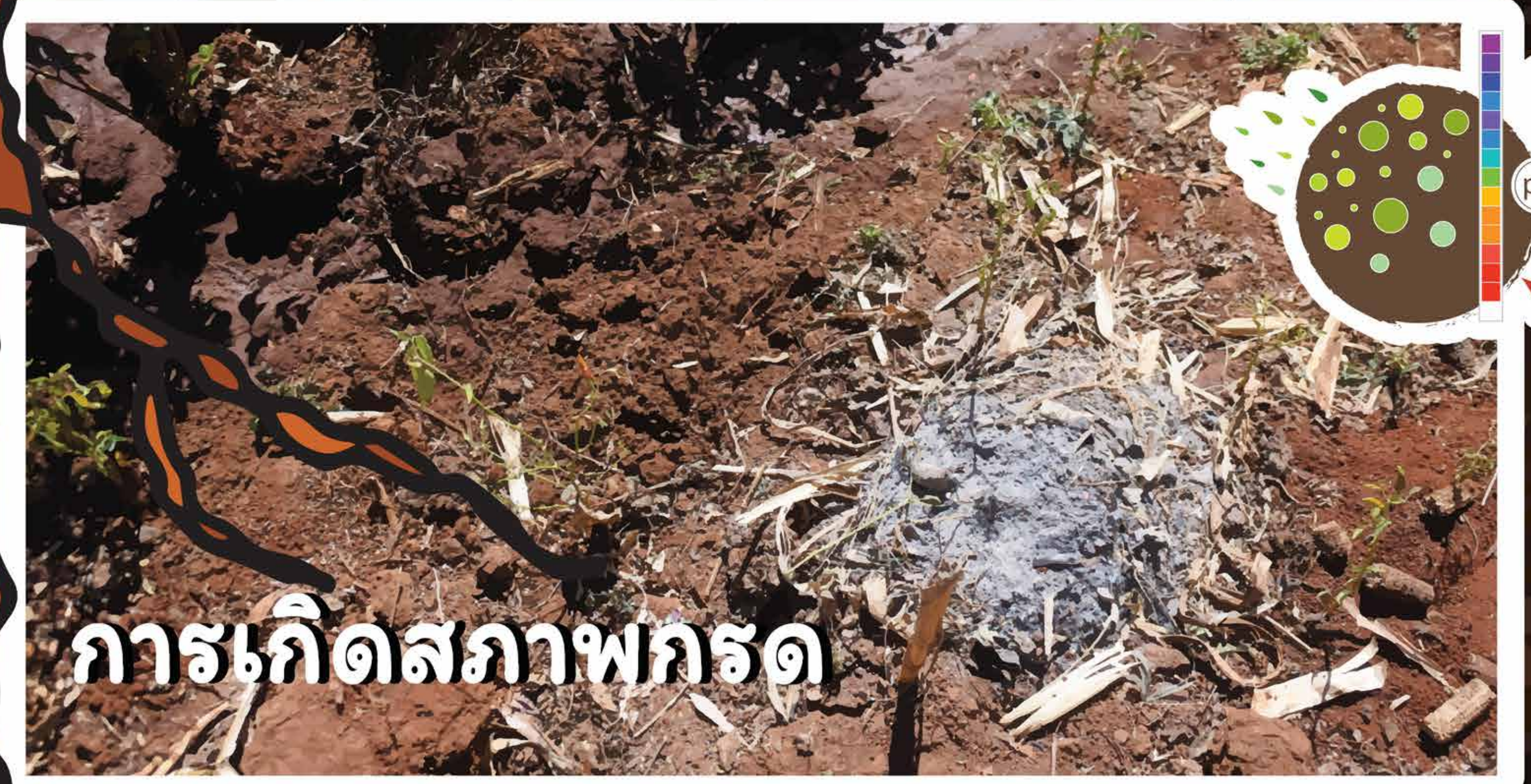
การเกิดสภาพกรด