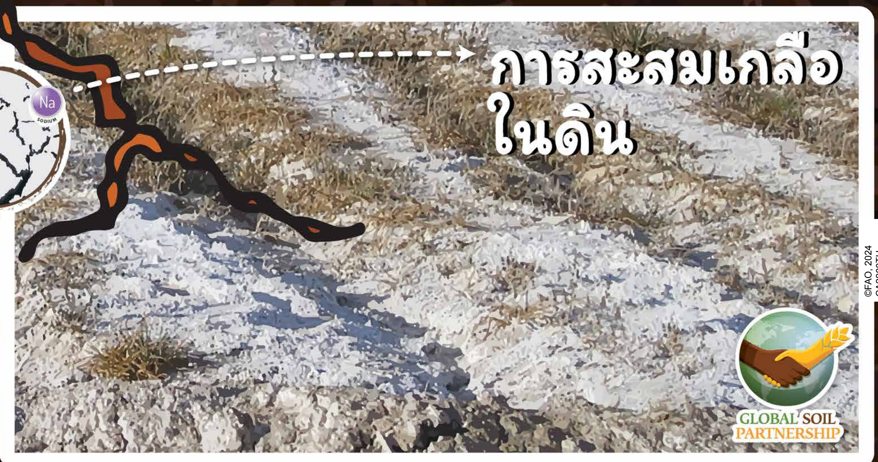
การสะสมเกลือ ในดิน