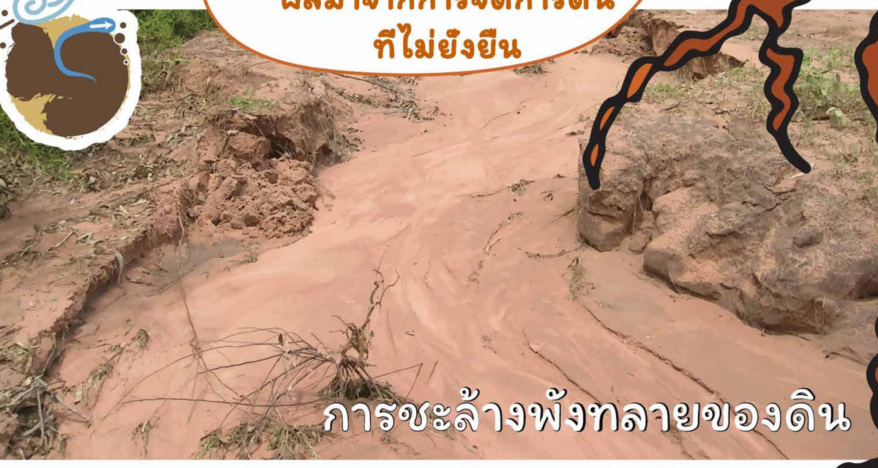
การชะล้างพังทลายของดิน

สาเหตุของความ ล้มเหลวในการปลูกพืชที่เป็น ผลมาจากการจัดการดิน ที่ไม่ยั่งยืน