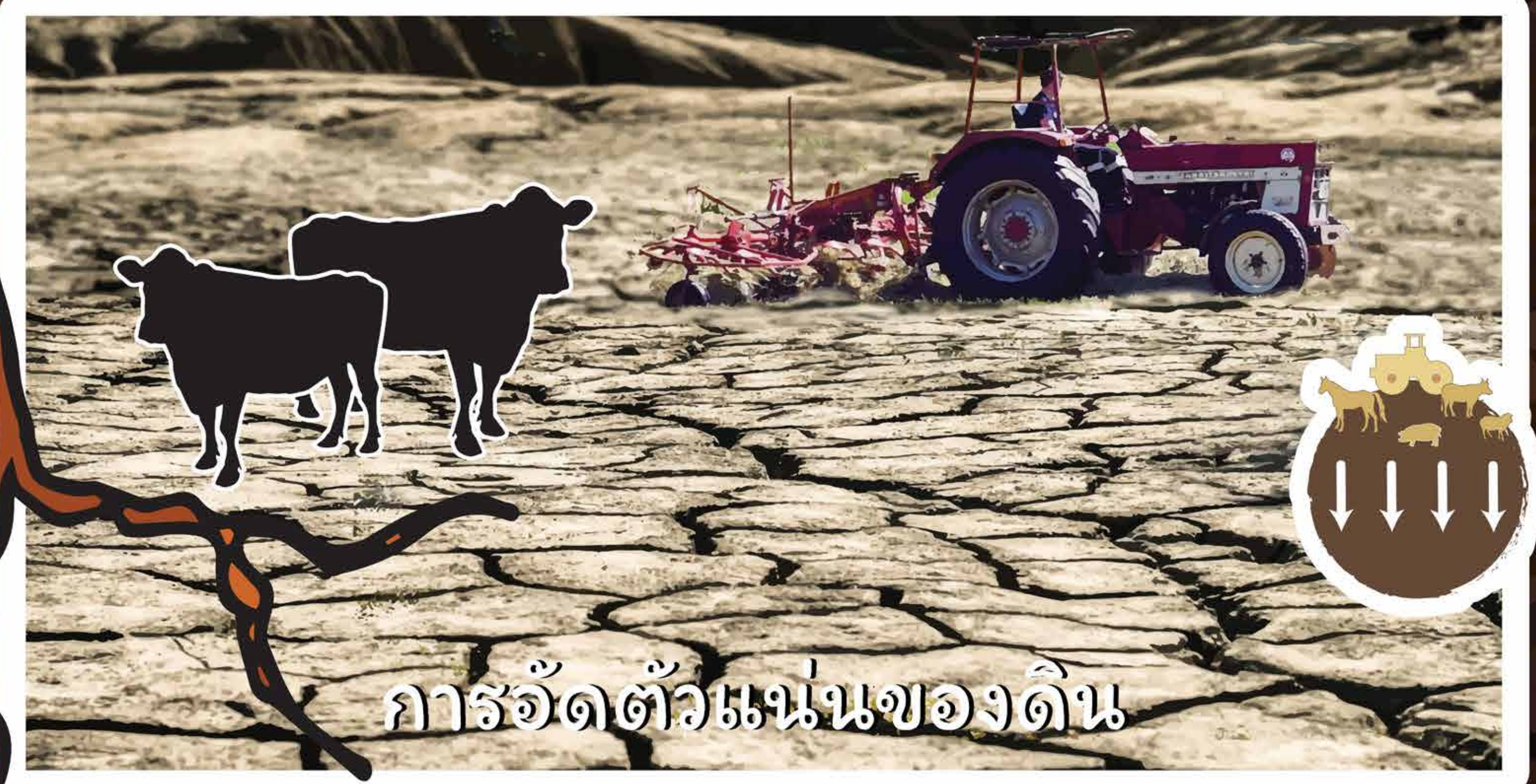
การอัดตัวแน่นของดิน