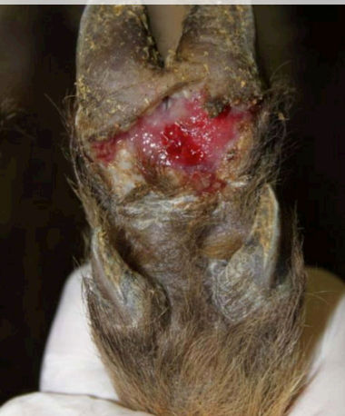
Фиг. 3. Шапна лезия върху копито на диво прасе