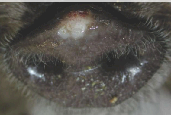
Фиг. 1. Диво прасе, заболяло от шап. Мехурче по рилото.