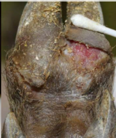
Фиг. 4. Шапна лезия върху копито на диво прасе