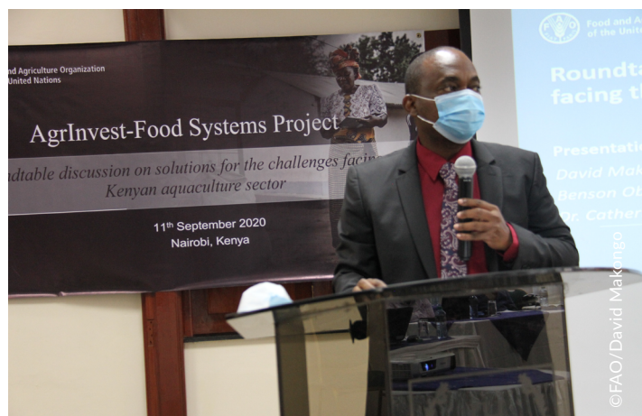
Figure 3 Mot d'ouverture à l'Atelier national sur l'aquaculture au Kenya

Le 11 septembre 2020, dans le cadre du projet AgrInvest-Systèmes alimentaires, un débat en table ronde sur les « Solutions aux défis auquel est confronté le secteur de l'aquaculture au Kenya » a eu lieu à Nairobi (Kenya).