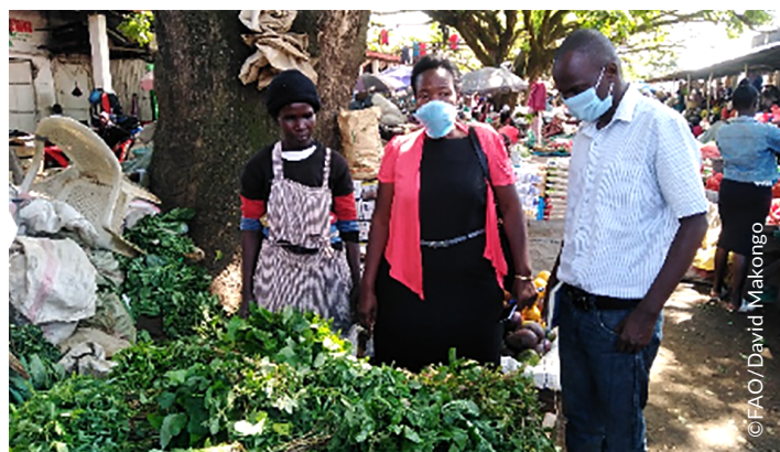
Figure 1 Visite de terrain dans le cadre du projet AgrInvest-SA au Kenya pour évaluer les perturbations des marchés locaux causées par les mesures de confinement imposées à la suite de la pandémie.

Dans le contexte de la pandémie mondiale de la Covid-19, où la perturbation des chaînes d'approvisionnement et de leurs systèmes alimentaires est très préoccupante, des projets tels qu'AgrInvest-SA sont devenus cruciaux, car ils permettent de réduire les risques et les effets du développement pour les investisseurs, et de soutenir les chaînes d'approvisionnement alimentaire, en créant des mécanismes durables et résilients, favorables à la transformation des systèmes alimentaires.