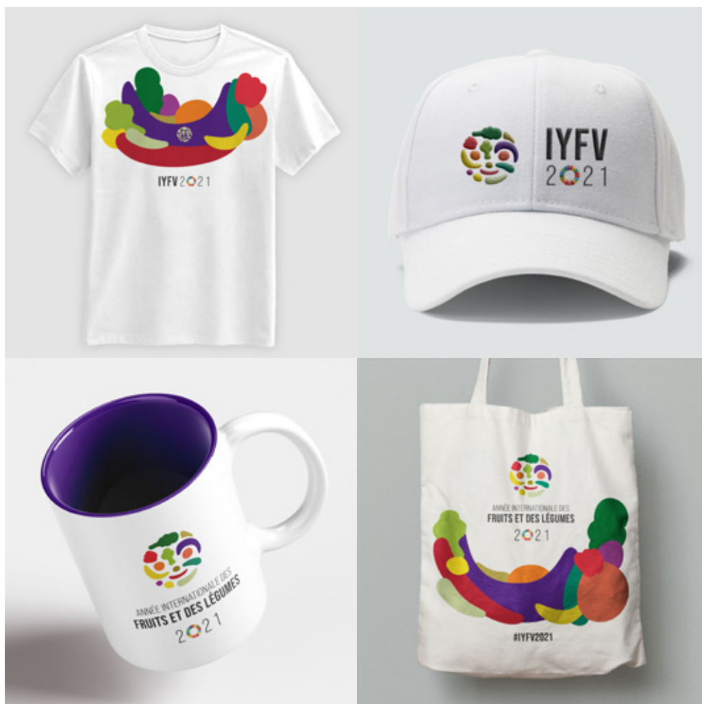
Figure 7: Casquette Figure 8: Tasse Figure 9: T-Shirt Figure 10: Sac fourre-tout