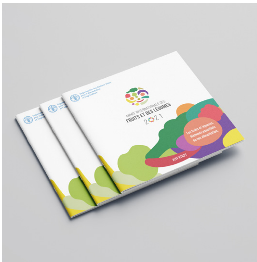
Figure 4: Brochure

La brochure, disponible d'ici peu, pourra être téléchargée dans toutes les langues officielles de l'Organisation des Nations Unies (ONU) depuis la Bibliothèques de ressources numériques .