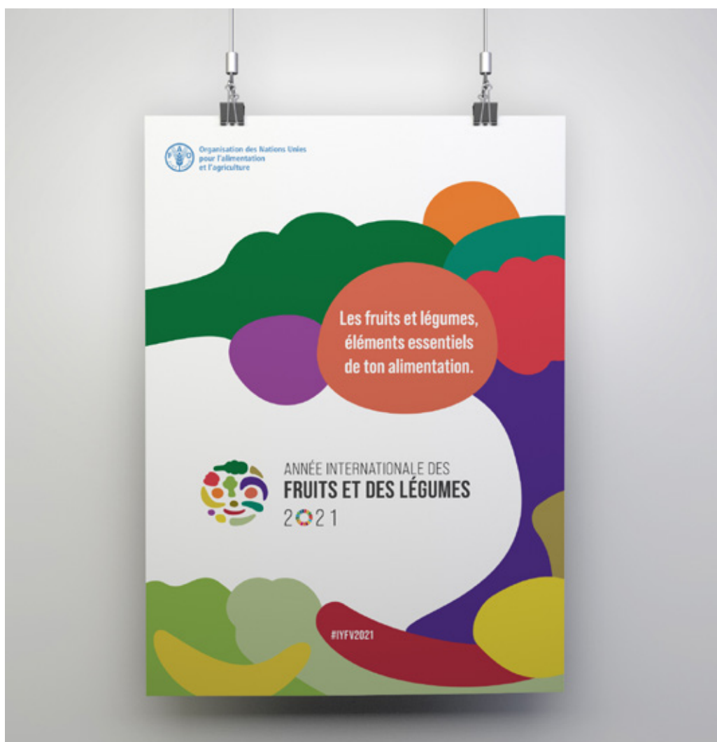
Figure 3: Affiche

L'affiche de l'Année internationale est téléchargeable sur la Bibliothèque de ressources numériques de l'Année internationale . Les dimensions standard sont de 700 x 500 cm, disponibles à la fois au format horizontal et au format vertical, mais d'autres mesures peuvent être fournies sur demande auprès de l'équipe de l'Année internationale, en écrivant à l'adresse suivante: IYFV@fao.org .