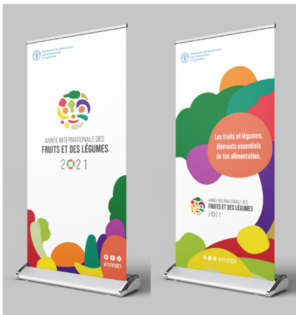
Figure 5 et 6: Bannières