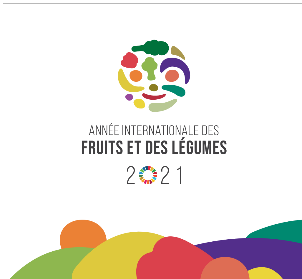
Figure 1: Identité Visuelle

Si vous avez la moindre question, veuillez nous écrire à l'adresse suivante: IYFV@fao.org . Notre équipe de graphistes peut vous conseiller en cas d'autres problèmes liés à l'utilisation de l'identité visuelle, qu'il s'agisse de la disposition du logo ou des différentes exigences liées au format (taille ou mise en page). Pour vous aider à organiser vos événements, nous avons également préparé des bannières, des affiches, des modèles PowerPoint et d'autres matériels entièrement personnalisables. Vous pouvez les retrouver dans la Bibliothèque de ressources numériques (en anglais).