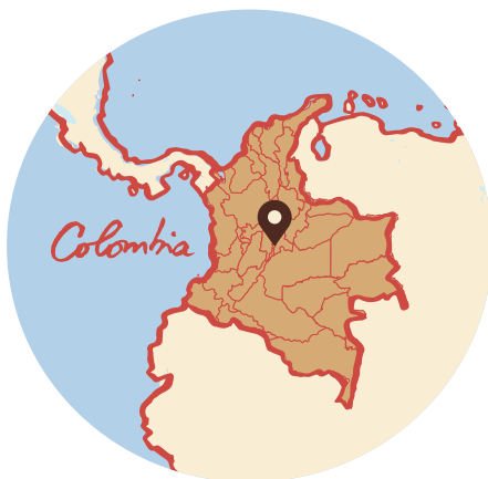
Datos del Departamento Administrativo Nacional de Estadística (DANE) para 2018

Para fortalecer la articulación y aprovechar el potencial efecto sinérgico entre los programas, se propone una Estrategia de Atención Articulada para contribuir al objetivo de reducción de la pobreza y la atención a las víctimas del conflicto armado.