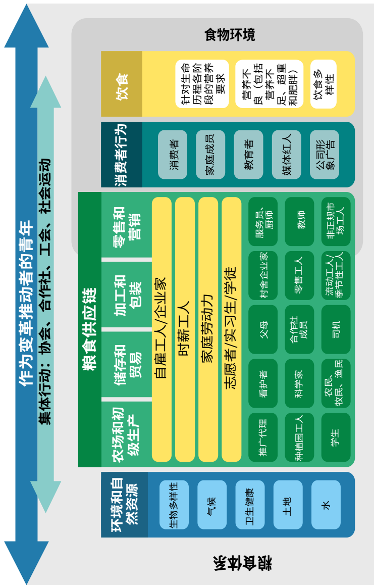
图 1 粮食体系中青年能参与和就业的作用及空间