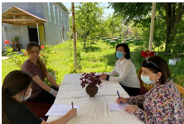
Встреча по выявлению потребностей бенефициаров проекта

В целях обеспечения устойчивости подхода, ФАО ведет работу с сельскими консультационными службами, с тем чтобы их консультации для сельских общин становились более адресными и учитывали различия в потребностях женщин и мужчин-фермеров. Кроме того, ФАО сотрудничает с Агентством аграрного кредитования и развития при Министерстве сельского хозяйства Азербайджана для распространения среди женщин информации о доступных кредитных услугах. Их представители присоединяются к нашим консультациям с сельскими общинами для более эффективного распространения информации о существующих возможностях.