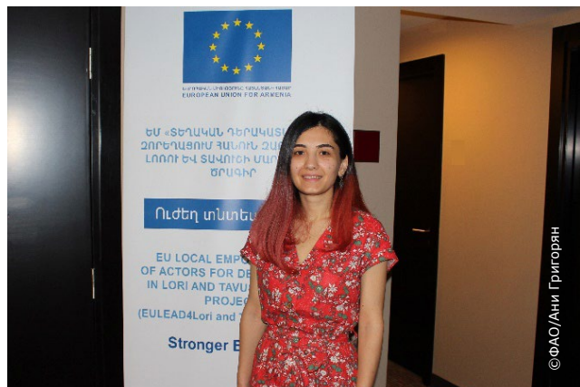
Участница тренинга проекта LEAD

и общин имеет двойной эффект - с одной стороны, у местной молодежи и женщин появляется возможность заявить о себе и более активно участвовать в процессах регионального развития и принятия решений; с другой стороны, создаются предпосылки для того, чтобы такие организации, как ФАО, более чутко реагировали на потребности и приоритеты этих групп.