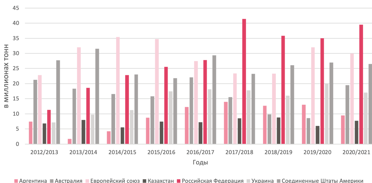
Рисунок 1: Объем мирового экспорта пшеницы основных экспортеров