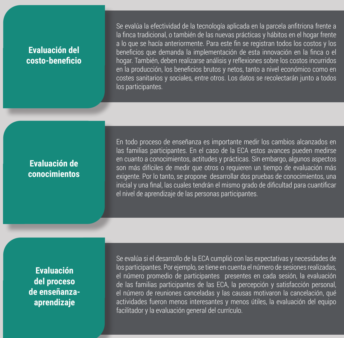
Figura 2. Aspectos propuestos para la evaluación de la escuela de campo