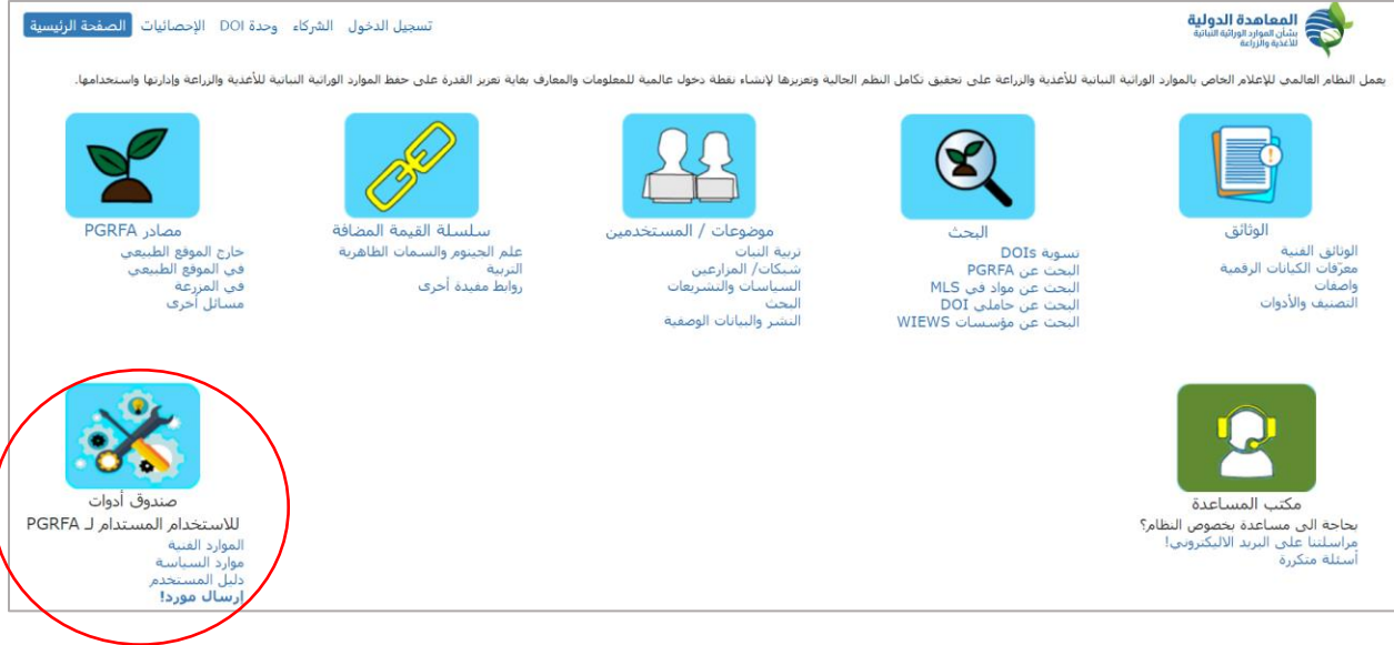
الرسم 5. الوصول إلى مجموعة الأدوات من خلال بوابة النظام العالمي للإعلام