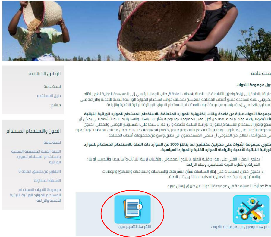
الرسم 3. الوصول من خلال صفحة الويب لمجموعة الأدوات على الموقع الإلكتروني للمعاهدة الدولية

مجموعة الأدوات للاستخدام المستدام للموارد الوراثية النباتية للأغذية والزراعة