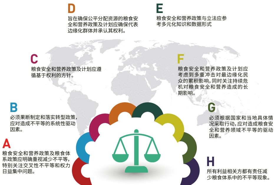
图12 注重公平和平等的政策及行动原则