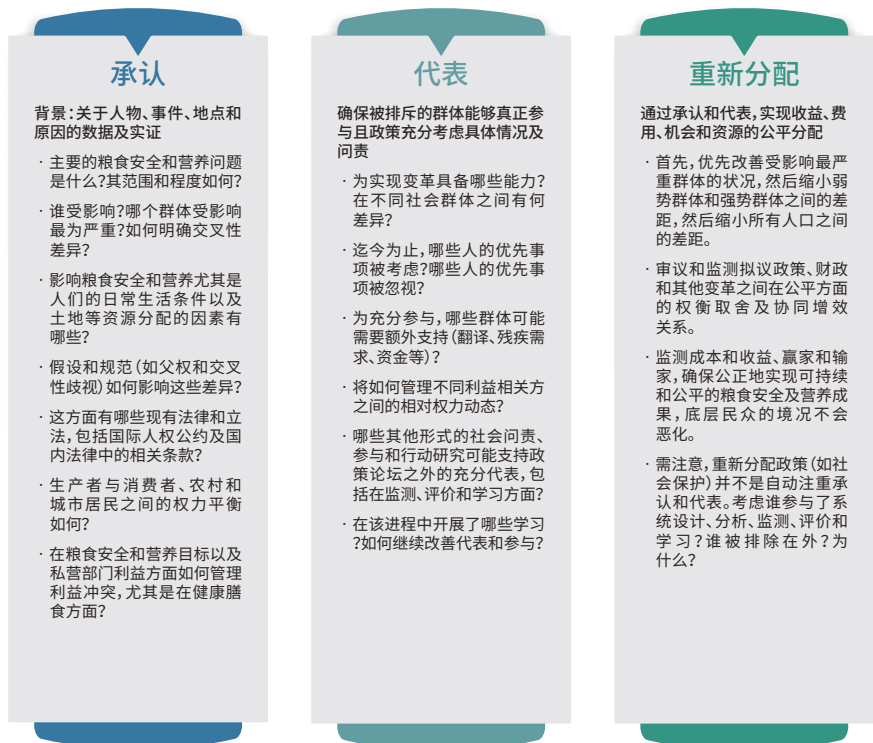
图13 制定注重公平政策的路线图

图13基于第1章框架,尤其是作为“公平引擎”的承认、代表和重新分配原则,提出制定注重公平政策的路线图。尽管建议这项工作由政府牵头,但并非所有政府都具备采取这种详细方法的意愿和能力。因此,可在政府之外开展评估,例如,由民间社会组织进行,作为实现粮食安全和营养变革的重要倡导工具,或由政府间组织进行,直接支持加强政府在该领域的能力。