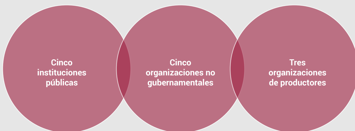
Figura 1. Configuración del Comité Gestor de la REDSSAN provincial de Monte Plata