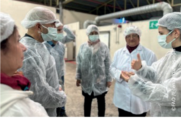
Tariş Kooperatif'i'nin incir depolama ve işleme tesislerini ziyaret eden katılımcılar.

İncir sektörünün güçlendirilmesi için stratejik işbirliği vurgulanmış ve işlenmiş incir ürünlerinin ihracatına ilişkin pratik tartışmalara yer verildi. Lansmanın başarısı, Türkiye'nin sürdürülebilir tarımsal gıda sistemleri konusundaki kararlılığında dönüştürücü bir adım anlamına geliyor. Katılımcılar ayrıca İncir Araştırma Enstitüsü'nü ve incir kurutma tesislerini ziyaret ederek sektördeki en iyi uygulamalar hakkında bilgi edindiler. OCOP, Özel Tarım Ürünleri geliştirerek ve değer zincirindeki boşlukları ele alarak kapsayıcı ve sürdürülebilir gıda sistemlerini teşvik etmeyi amaçlıyor.