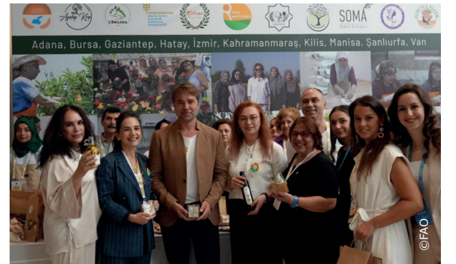
HepYerinden, kooperatifler için dijital bir merkez görevi görerek işbirliği ve birleşik bir kimlik için bir alan sağlıyor.

Avrupa Birliği tarafından finanse edilen "Güçlü Geçim Dayanıklı Toplum projesinin iş gücü piyasası etkisi bağımsız bir araştırma ekibi tarafından değerlendirildi. Değerlendirmenin bulguları, "Projenin Faydalanıcıların