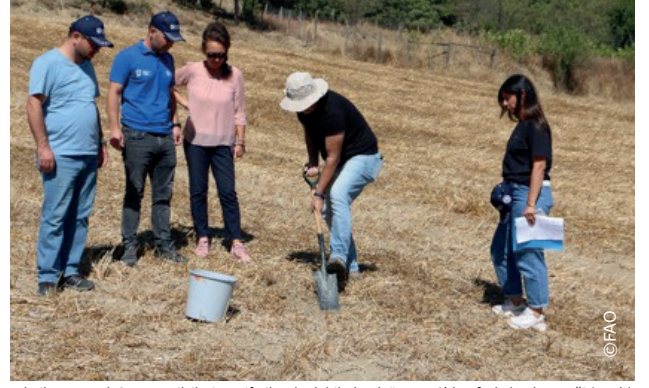
Teknik personel, STK temsilcileri ve çiftçiler de dahil olmak üzere 50'den fazla katılımcı eğitim aldı.

Bolu'da proje kapsamında Seben ve Yeniçağa ilçelerindeki çiftçilere verilen uygulamalı eğitimler sonrası 17 ayrı noktadan toprak örnekleri alındı. Seben ve Yeniçağa