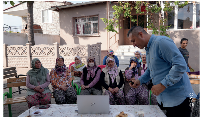
Dijital platform, uygulamaliciftciokulu.org, çiftçilere pratik ve interaktif eğitim kaynaklarına erişim imkanı sunuyor.

FAO Türkiye, bu platform aracılığıyla çiftçilere modern