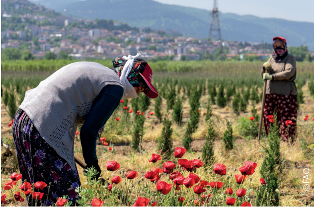
Çalışmanın bulguları, projenin hedeflerine ulaştığını gösterdi.

Geçim Kaynakları ve Yerel İşgücü Piyasası Üzerindeki Etkisi" adlı bir raporda derlendi. Rapor bulguları, projenin istihdam, beceri geliştirme ve dayanıklılığı artırma ile ilgili hedeflerine ulaştığını gösteriyor. Raporda dikkat çeken bulgulardan biri, projeye kadınların yüksek oranda katılımıdır; bu katılım bazı bölgelerde erkek katılımcıların sayısına eşit ya da daha fazladır. Bu veriler, projenin cinsiyet eşitliğini teşvik etme ve işgücünde kadınları güçlendirme konusundaki etkinliğini vurguluyor. Elde edilen bu önemli rakamlar ve bulgular, projenin yerel işgücü piyasası üzerindeki önemli etkisini ve topluluklardaki ekonomik ve sosyal refahı artırma yönündeki odaklanmış çabaların değerini gösteriyor. Rapor ayrıca, özellikle tarım sektöründe, yararlanıcılar arasında mesleki becerilerde kayda değer bir gelişme olduğunu ve daha sürdürülebilir ve dirençli geçim yollarına doğru olumlu bir değişim olduğunu belirtiyor. Genel olarak, bulgular projenin toplulukları güçlendirme ve tarımı hem geçerli hem de ödüllendirici bir alan olarak teyit etme konusundaki başarısını yansıtıyor.