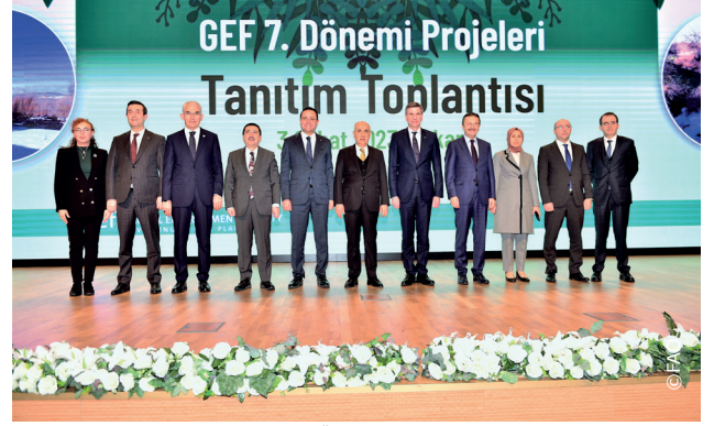
GEF 7'nin lansmanı Tarım ve Orman Bakanlığı ile birlikte yapıldı.

2023 yılı Küresel Çevre Fonu programı için çok görünürlüğü yüksek ve faaliyetler açısından verimli bir yıl oldu. GEF 7 dönemi projelerinin Tarım ve Orman Bakanlığı iş birliğinde yoğun bir katılım ile lansman etkinliği düzenlendi. Kaz Dağları projesi, Gediz projesi ve Bolu Projeleri'nin lansman etkinlikleri gerçekleştirildi. Gediz Projesinde gençlerin katılımı gerçekleştirilen flamingo halkalama faaliyeti büyük bir ilgi ile karşılandı. Arazi Tahribatının Dengelenmesi Yukarı Sakarya Projesi kapsamında devam eden Uygulamalı Çiftçi Okullarının ilk etabı 97 çiftçinin katılımı ile tamamlandı ve ikinci etabına başlandı.