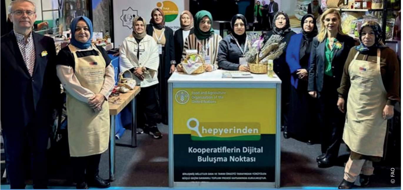
Türkiye'nin dört bir yanından 10 kadın kooperatifinin oluşturduğu FAO destekli bir dijital pazarlama ağı olan hepyerinden.koop, katıldığı 5. Türkiye Kooperatifler Fuarı'nda büyük ilgi gördü.