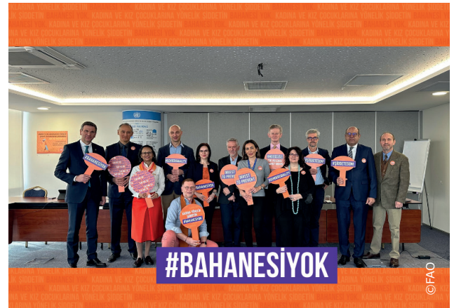
BM Türkiye ekibi 16 Gün aktivizmi için güçlerini birleştirdi.

Birleşmiş Milletler bu yıl 16 Günlük Aktivizmi tüm dünyada "BİRLEŞİN! Kadınlara ve Kız Çocuklarına Yönelik Şiddeti Önlemek için Yatırım Yapın" teması ile başlatıyor. #BahanesiYok sloganını kullanan kampanya, kadınlara ve kız çocuklarına yönelik şiddetin önlenmesi için yatırım yapılması ve toplumsal normların dönüştürülmesi için çağrıda bulunuyor.