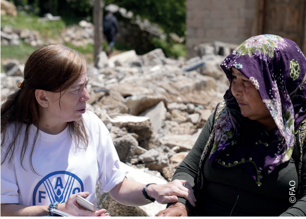
ERRP, Türkiye'de Şubat ayında meydana gelen depremlerin mağdurlarına yardım sağlıyor.

6 Şubat 2023'te Türkiye'nin tarım, ormancılık, balıkçılık, hayvancılık ve süt üretimi açısından hayati öneme sahip 11 ilini etkileyen depremler sonrası, FAO, Tarım ve Orman Bakanlığı ve diğer ortaklarla birlikte tarım sektörünün ihtiyaçlarını değerlendirmek ve müdahalelerde bulunmak adına iş birliği içinde çalışıyor.