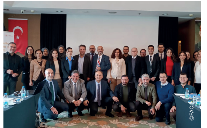
Tacikistan, Türkiye ve Özbekistan'dan Ordu'daki çalıştay katılımcıları.

"Kimseyi geride bırakma: Türkiye ve Orta Asya'da kırsal kesimde kadınların güçlendirilmesi ve daha fazla katılımının sağlanması" projesi kapsamında 13-14 Aralık 2023 tarihlerinde Ordu'da düzenlenen iki günlük bölgesel çalıştay, Tacikistan, Türkiye ve Özbekistan'dan bakanlık ve devlet kurumlarından katılımcıları bir araya getirdi. Çalıştay kapsamında, tarım, ormancılık ve gıda güvenliği alanlarında çalışan hükümet yetkilileri, geride kalma riski taşıyan kırsal kesimdeki kadınların ihtiyaçlarına yönelik sosyal kapsayıcı ve toplumsal cinsiyete duyarlı politika ve uygulamalar konusunda kurumlarının deneyimlerini paylaştı. Çalıştayda ayrıca, Tarım ve Orman Bakanlığı tarafından oluşturulan toplumsal cinsiyet birimlerine ziyaretler ve programdan yararlanan kırsal kesimdeki kadınlarla görüşmeler gerçekleştirildi.