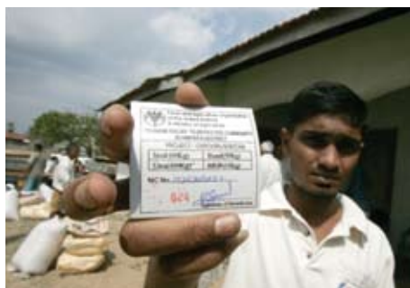
Un agriculteur victime du tsunami au Sri Lanka montre une carte qui lui donne droit à des semences et des engrais distribués par la FAO.

Grâce à son mandat de développement et à sa capacité institutionnelle d'effectuer une transition en douceur de la phase de réhabilitation à celle de l'aide au développement à long terme, la FAO concentre ses interventions d'urgence sur l'aide aux communautés afin de renforcer leurs compétences et d'améliorer leurs exploitations.