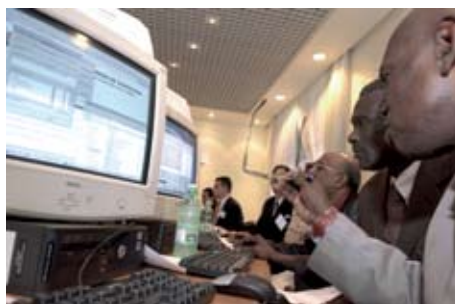
Les statisticiens apprennent à utiliser une base de données de la FAO lors d'un atelier de formation.

L'apprentissage à distance et sur ordinateur est en train de supplanter les anciennes méthodes d'enseignement en face à face tels que cours, ateliers, et apprentissage sur le tas. Des matériels pédagogiques ad hoc sont disponibles sur le portail de renforcement des capacités de la FAO ( www.fao.org/capacitybuilding ). Des programmes de bourses universitaires sont gérés en collaboration avec les gouvernements et les institutions, la FAO faisant fonction de facilitateur. Par exemple, un programme créé avec le Ministère hongrois de l'agriculture offrira des bourses à cent étudiants de divers pays sur une période de cinq ans pour obtenir une maîtrise en diverses disciplines agricoles.