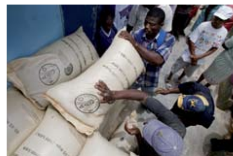
Distribución de emergencia de semillas en Haití.

no estatales en el proceso de desarrollo, y fortalecer las instituciones locales de los gobiernos con la finalidad de combatir el hambre y la malnutrición. Se promueve la formación de alianzas directas entre ciudades y regiones, donde la FAO funciona como catalizador y proveedor de apoyo técnico y operativo.