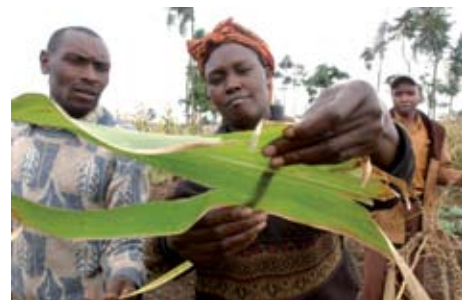
Escuela de campo para agricultores en Kenya.

La FAO suministra análisis de los cambios mundiales y sus consecuencias nacionales y regionales. Ayuda a los gobiernos a formular y examinar sus políticas y estrategias nacionales en materia de agricultura y desarrollo rural. Algunos ejemplos son la ayuda a países en desarrollo para entender las repercusiones de las posiciones en las negociaciones comerciales y en la aplicación de los acuerdos de la Organización Mundial del Comercio, asesoramiento a los gobiernos sobre medidas normativas en respuesta ante la crisis de los precios de los alimentos o para establecer las prioridades del desarrollo agrícola y rural en el marco vigente de desarrollo, como las Estrategias de lucha contra la pobreza.