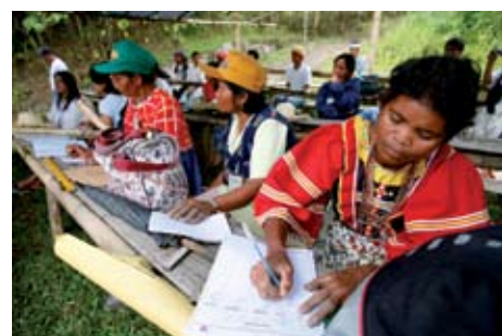
Aldeanos asisten a un curso de capacitación para agricultores en Mindanao, las Filipinas.